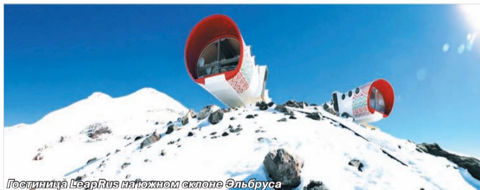
Гостиница LeapRus на южном склоне Эльбруса

году ОАО «КСК» организовало музыкальный фестиваль «WOMAD», но из-за сложной политической ситуации его иностранные основатели решили больше не сотрудничать с Россией. Все звание к голосу разума со стороны ООО «СКГК» зарубежные коллеги проигнорировали.