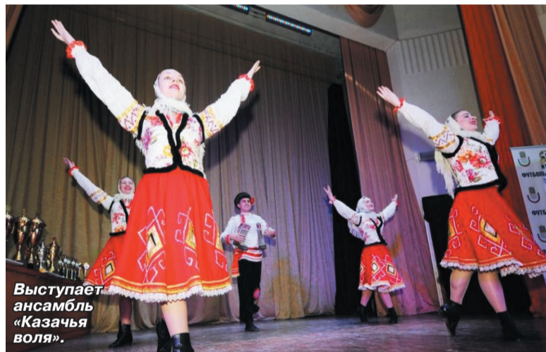
Выступает ансамбль «Казачья воля».

10 декабря отмечается Всемирный день футбола. А в Ставрополе, по традиции, накануне праздника Федерацией футбола СК проводится торжественная церемония закрытия очередного футбольного сезона.