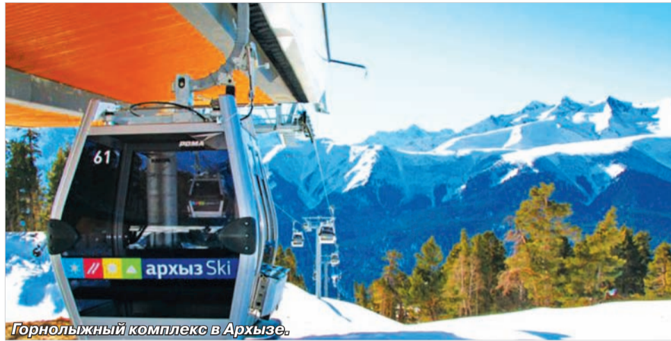
Горнолыжный комплекс в Архызе.

«Северо-Кавказский горный клуб» работает всего год. Его главная цель – создать единую туроператорскую структуру на Кавказе. Компания занимается круглогодичной организацией активного и экстремального туризма. Две ее главные гордости – новая футуристичная гостиница на южном склоне Эльбруса и «Аланский путь» – экспедиция на семи новеньких Toyota Land Cruiser по неизведанным горным маршрутам. А в прошлом