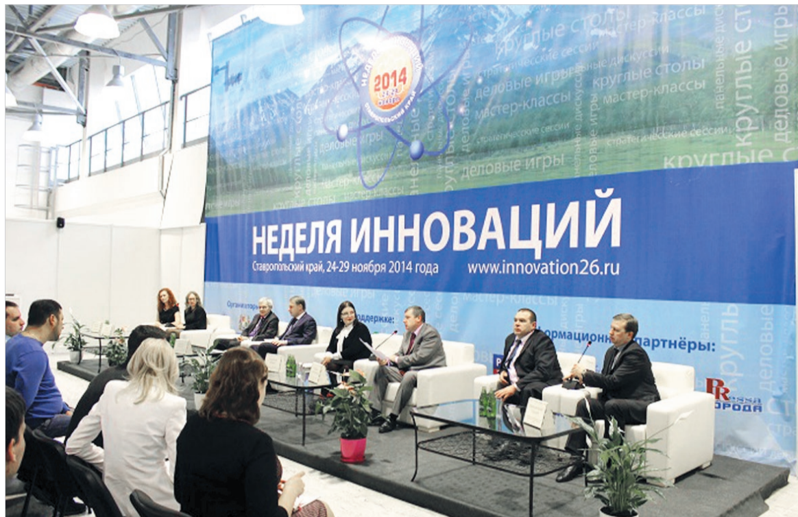
«Неделя инноваций» на Ставрополье.

— Это удивительная история: промышленные предприятия