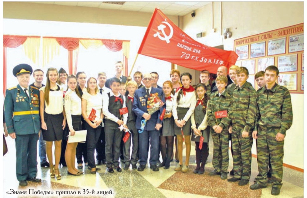
«Знамя Победы» пришло в 35-й лицей.