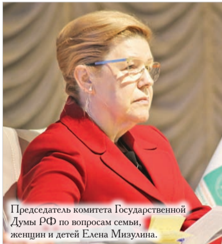
Председатель комитета Государственной Думы РФ по вопросам семьи, женщин и детей Елена Мизулина.