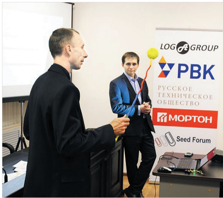
Презентация проекта нового ветрогенератора.