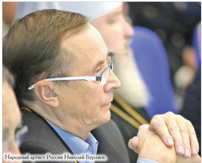
Народный артист России Николай Бурляев.