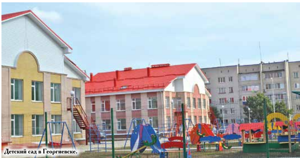
Детский сад в Георгиевске.