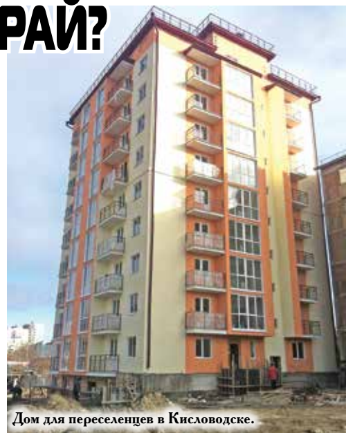
Дом для переселенцев в Кисловодске.

Модернизация экономики, развитие инноваций, малого и среднего бизнеса, поддержка конкуренции и улучшение инвестиционного климата - без работы в этом направлении край был бы отброшен на десятилетия. На эту программу общий объем финансирования