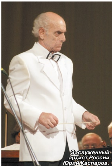
Заслуженный артист России Юрий Каспаров.