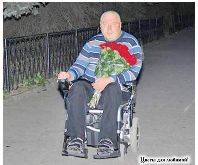
Цветы для любимой!