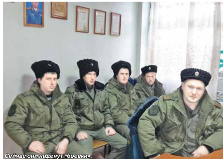
Сейчас они наденут «боевки».

По завершении «круглого стола» для приглашенных были проведены ознакомительные экскурсии по пожарным частям с демонстрацией вооружения и техники пожарных подразделений ФПС. Такие встречи проводились практически во всех пожарных частях края.