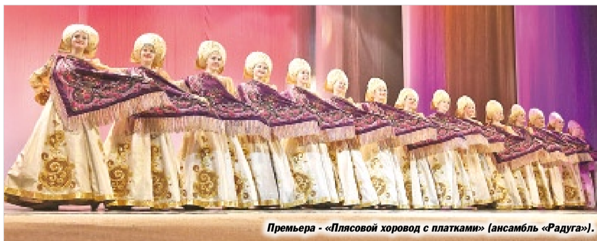
Премьера - «Плясовой хоровод с платками» (ансамбль «Радуга»).