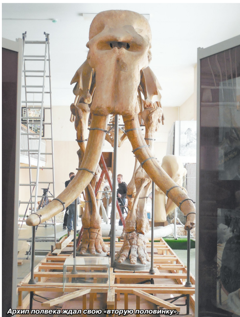
Архип полвека ждал свою «вторую половинку».

Ни много ни мало - именно такую задачу поставил в свой юбилейный год коллектив Ставропольского государственного музея-заповедника имени Г.Н. Прозрителева и Г.К. Пявее. То, что происходит в последнее время в зале палеонтологии, можно смело назвать историческим событием. Ежедневно его свидетелями становятся десятки посетителей музея.