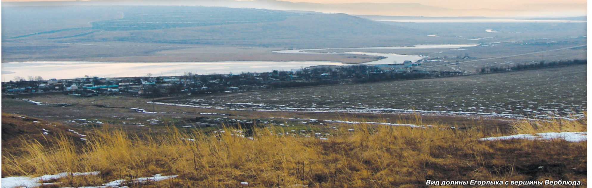
Вид долины Егорлыка с вершины Верблюда.

Детские увлечения меняются вместе с эпохой. Когда-то чуть ли не каждый второй школьник собирал марки, коллекционировал значки, медали и монеты. Немало было и тех, кто любил заглянуть в географический атлас, чтобы, прочитав заветное слово, представить себя на палубе корабля, плывущего к неведомой terra incognita.