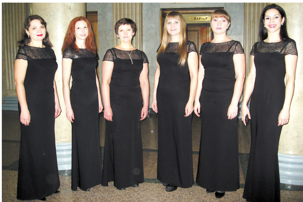
Участницы «Славянских встреч» – вокальный ансамбль «Кантанима».

Премия в номинации «Академическое хоровое пение», полученная этим коллективом на