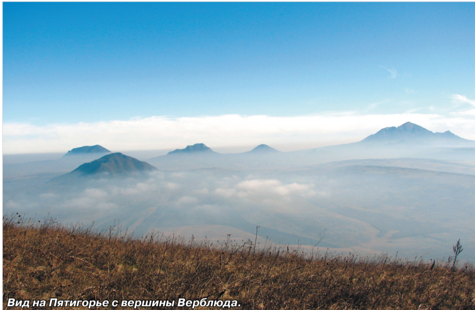
Вид на Пятигорье с вершины Верблюда.

В холодные периоды года в этих краях часто гостят туманы. Туман полностью