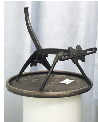
Мартовский кот Василия Чуйкова.