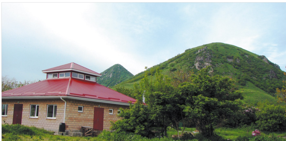
Буддистский центр у подножия Верблюда.