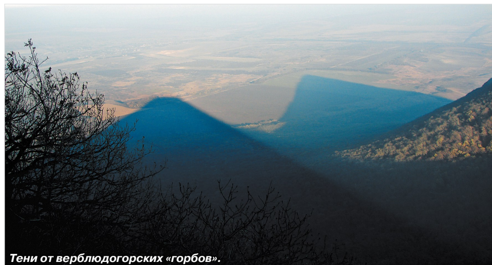
Тени от верблюдогорских «горбов».