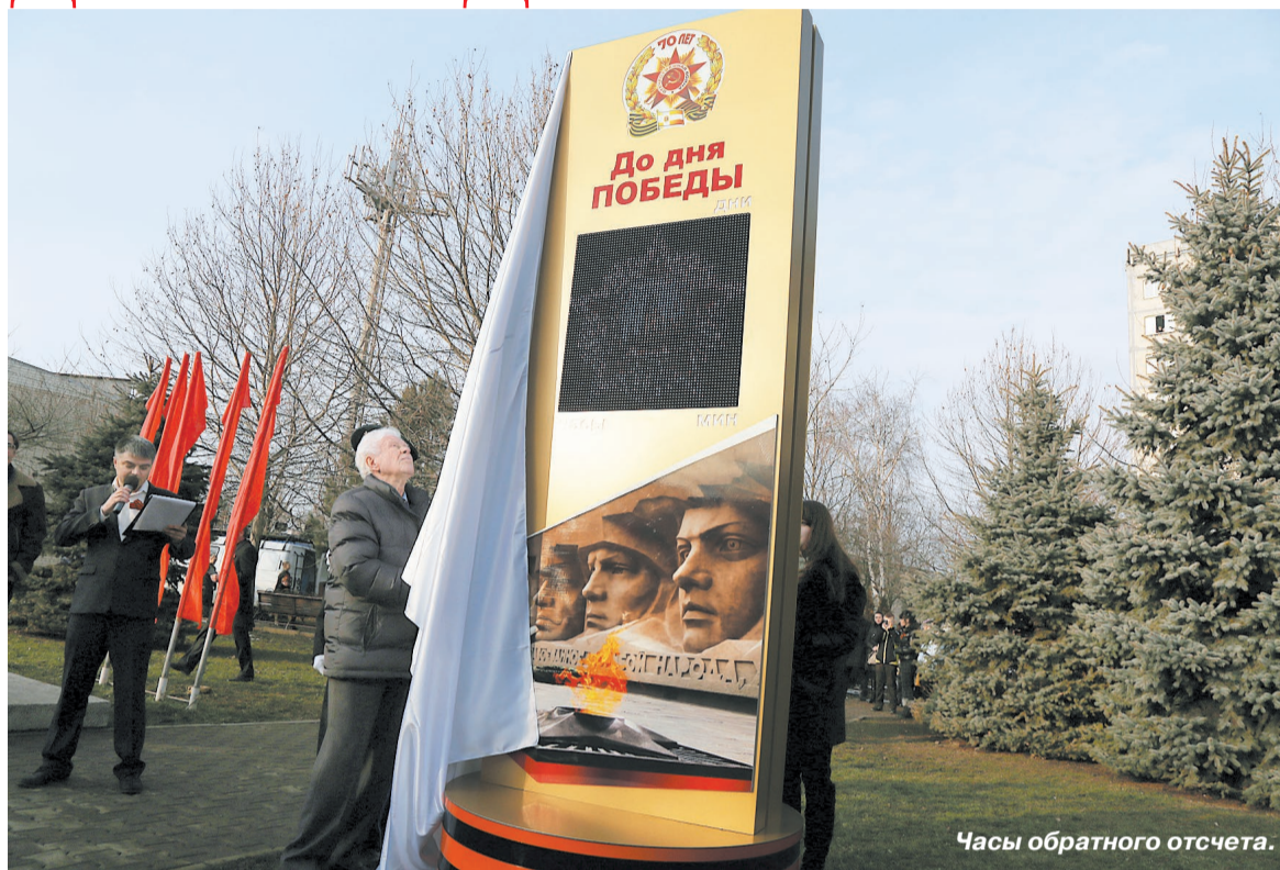
Часы обратного отсчета.

А потом тут же под часами выступила концертно-фронтальная бригада. До 9 Мая таким бригадам предстоит объездить порядка пятисот городов и районов края. На свой первый концерт в село Сенгилеевское артисты поехали