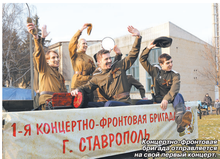
Концертно-фронтальная бригада отправляется на свой первый концерт.