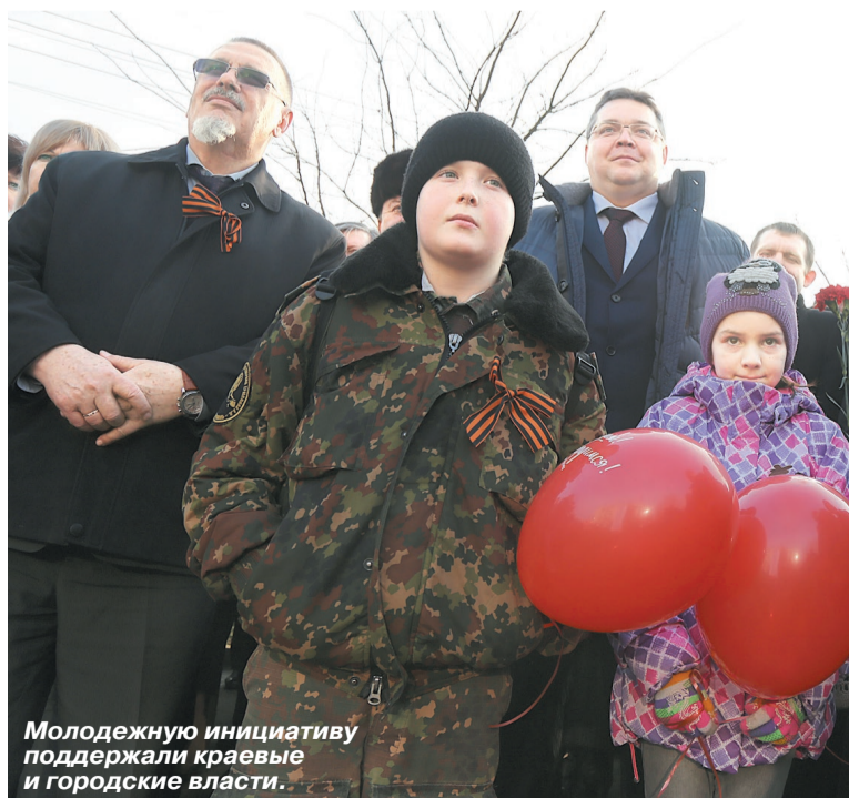
Молодежную инициативу поддержали краевые и городские власти.