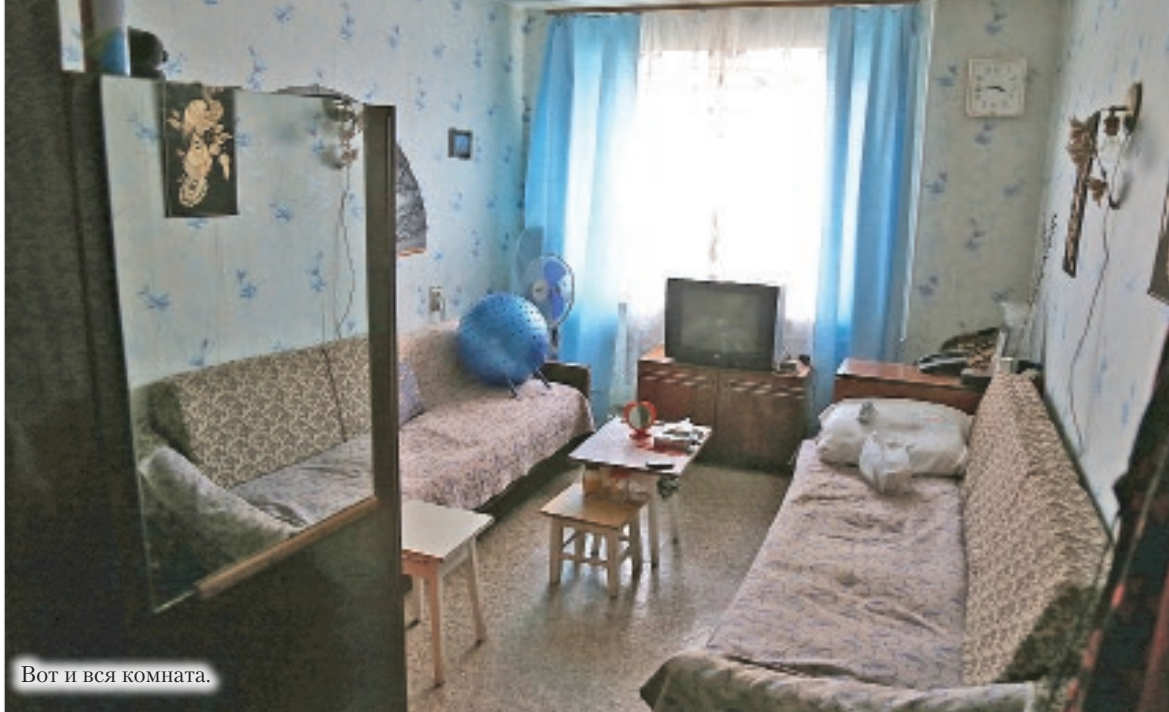
Вот и вся комната.