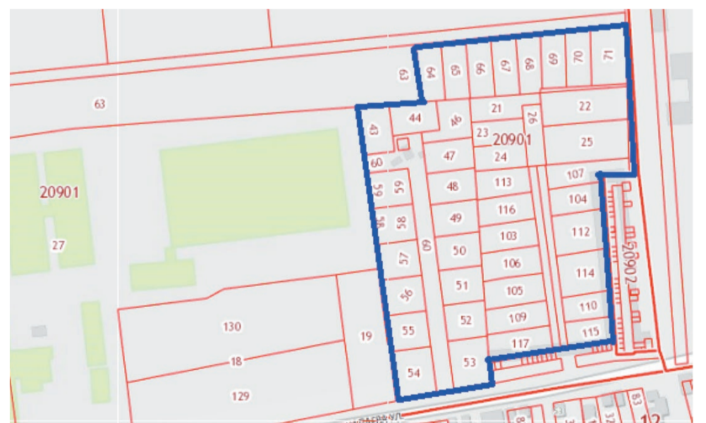
СХЕМА установления территориальной зоны Ж-1 - «зона многоэтажной жилой застройки (4 - 9 этажей)» в границах земельных участков в кадастровом квартале 26:12:020901

Приложение к сообщению о подготовке проекта о внесении изменений в Правила землепользования и застройки города Ставрополя, утвержденные решением Ставропольской городской Думы от 27 октября 2010 г. № 97 «Об утверждении Правил землепользования и застройки города Ставрополя»