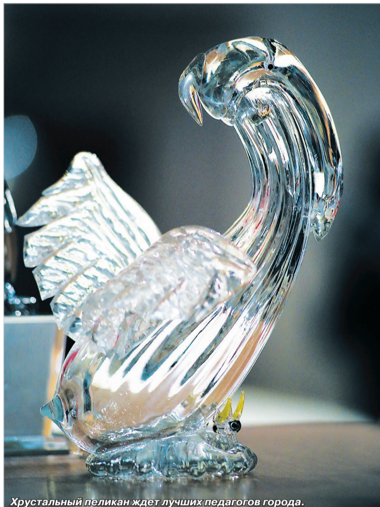
Хрустальный пеликан ждет лучших педагогов города.

Оценивать участников предполагается в двух номинациях: «Лучший учитель» и «Педагогический дебют». Для конкурса «Воспитатель года России – 2015» есть новость – здесь тоже будет две но-