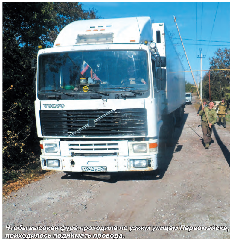
Чтобы высокая фура проходила по узким улицам Первомайска, приходилось поднимать провода.

В общем, все это очень не просто и очень долго. Но усталость и нервы компенсируются людской благодарностью. Мы доставляем гуманитарные грузы адресно и видим, как эта помощь нужна и как ее ждут.