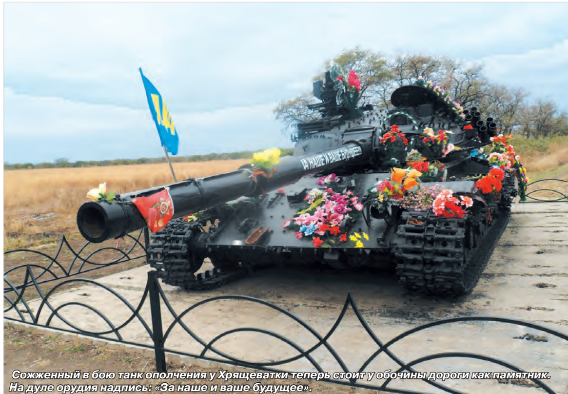
Сожженный в бою танк ополчения у Хрящеватки теперь стоит у обочины дороги как памятник. На дуле орудия надпись: «За наше и ваше будущее».