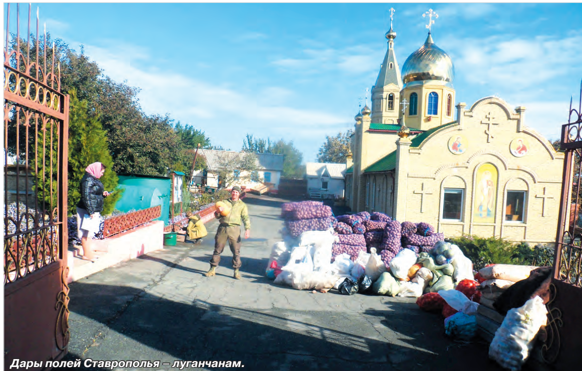
Дары полей Ставрополя — луганчанам.

Я поинтересовалась, известно ли педагогам, как сложилась судьба их бывших воспитанни-