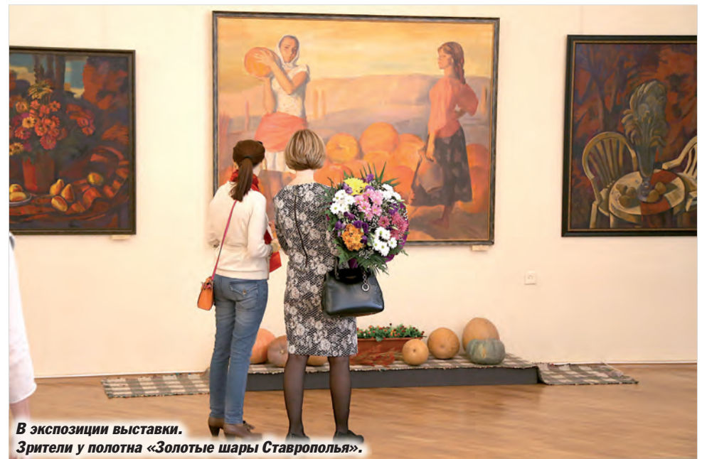
В экспозиции выставки. Зрители у полотна «Золотые шары Ставрополя».