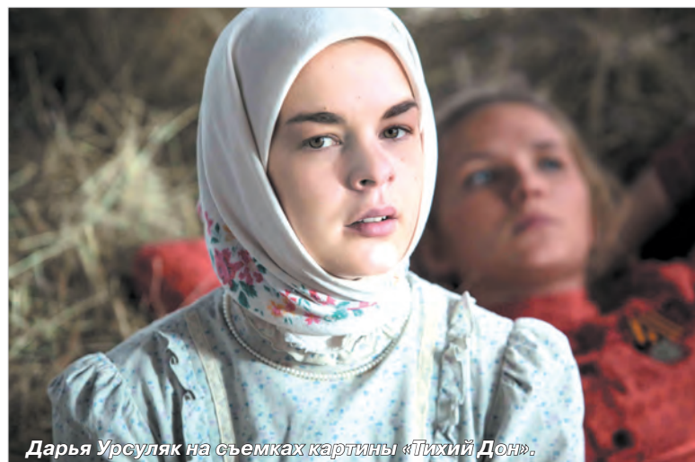
Дарья Урсуляк на съемках картины «Тихий Дон».

понятно: как это возможно в актерской профессии? Здесь или все – или ничего. А может, у меня самой изначально была сильная мотивация: я точно знала, зачем бросаю один вуз и иду в другой.