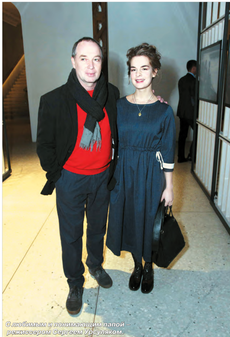
С любимым и понимающим папой – режиссером Сергеем Урсуляком.

ДОЧЬ ИЗВЕСТНОГО РЕЖИССЕРА И АКТРИСЫ ОТКРЫЛА ТАЙНЫ СВОЕЙ СЕМЬИ