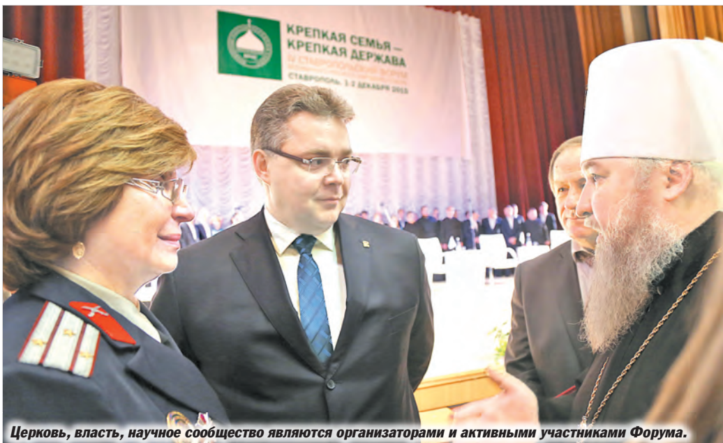
Церковь, власть, научное сообщество являются организаторами и активными участниками Форума.