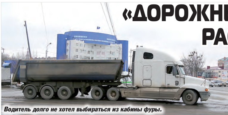
Водитель долго не хотел выбираться из кабины фуры.