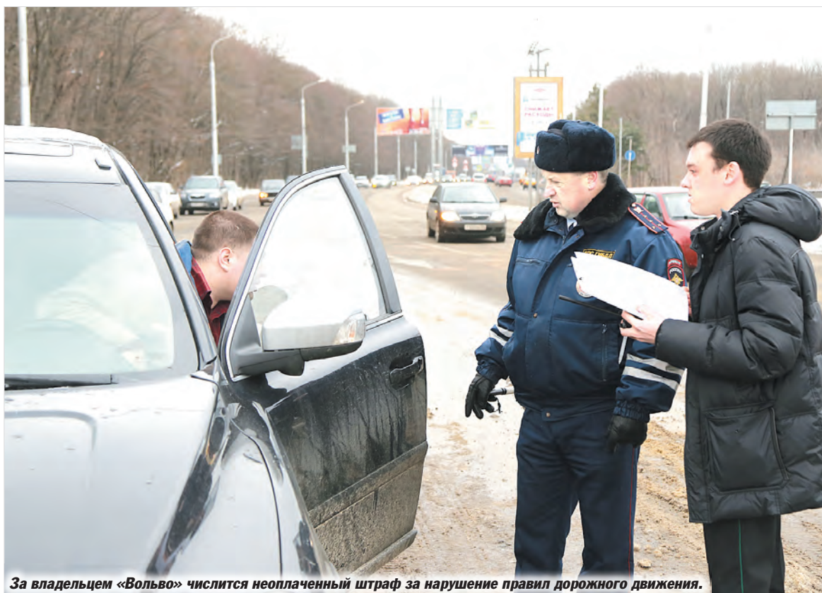
За владельцем «Вольво» числится неоплаченный штраф за нарушение правил дорожного движения.

В том, что должников у нас немереное количество, мы убедились в первые же минуты работы комплекса. Сотрудники ГИБДД только и успевали останавливать автомобили, информация о которых поступала с камеры. Как оказалось, должников — органи-