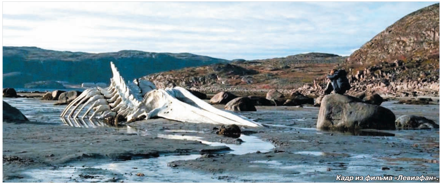
Кадр из фильма «Левиафан».

Отечественные фильмы, описывающие нашу с вами действительность, в подавляющем большинстве своём говорят одно: «Русские люди, вы – дерьмо. Ваша жизнь бессмысленна и беспросветна. У вас позорное прошлое, жалкое (и, в общем-то, заслуженное) настоящее и вообще никакого будущего». При этом общем базисе надстройка может быть разная. Одни режиссёры начинают через губу учить жизни, другие призывают к покаянию за все грехи, как правило – надуманные, третьи – просто развлекают этого зрителя, но тоже на уровне «А лучшего вы и не заслуживаете».