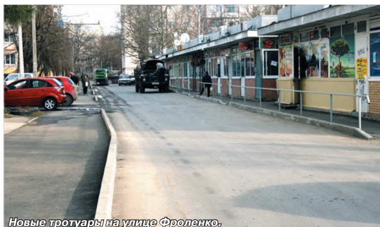
Новые тротуары на улице Фроленко.