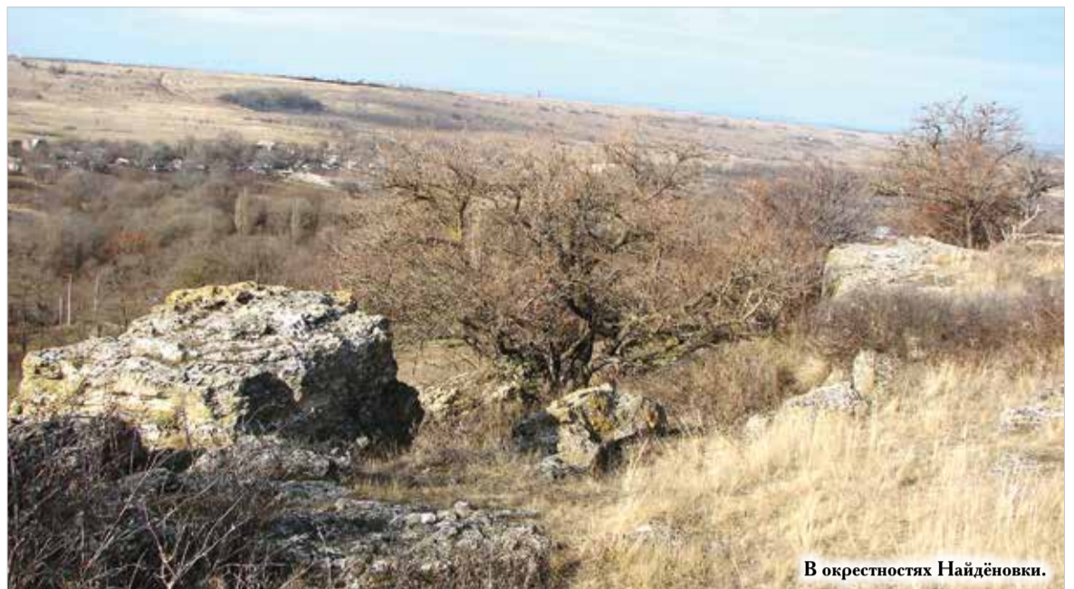
В окрестностях Найдёновки.

Вторая «неточность», гуляющая по просторам интернета, – снимок холма с одиноким деревом на откосе, под которым будто бы и находится пещера. По утверждению местной жительницы, пещер на том холме, что «замыкает» котловину с востока, нет вовсе, а приметный ориентир зовется деревом любви. Об этом чуть ниже, а пока опять вернемся к книге.