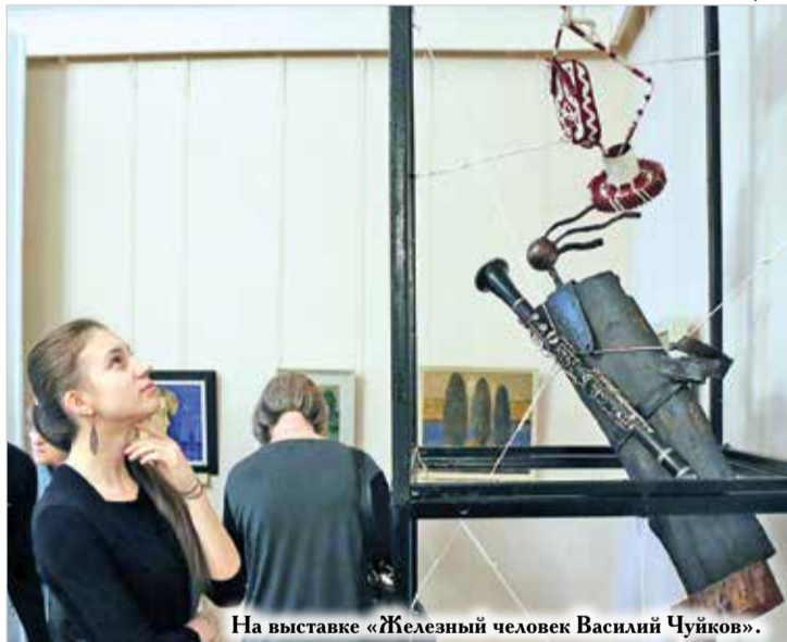
На выставке «Железный человек Василий Чуйков».

нии, со своим «неметаллическим» подтекстом. Достаточно взглянуть на изящные фигурки трёх граций или на почтового ангела, витающего в облаках чьих-то ожиданий.