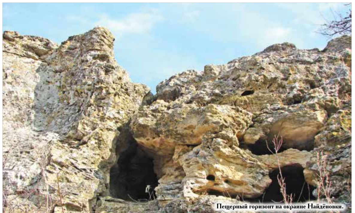
Пещерный горизонт на окраине Найдёновки.

Горы надежно защищали село от ветров. Родники и речки давали воду для полива, поэтому население помимо хлебопашества и скотоводства занималось также огородничеством и садоводством. Особенно славились овощи болгарина, фамилии которого история нам не сохранила. До сих пор найдёновские огороды называют болгарскими.