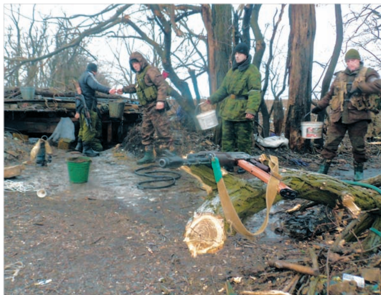
Из блиндажей периодически приходится откачивать воду.

не, это для бойцов очень важно. Они наперебой просят крестики, молитвословы, просят окропить оружие святой водой.