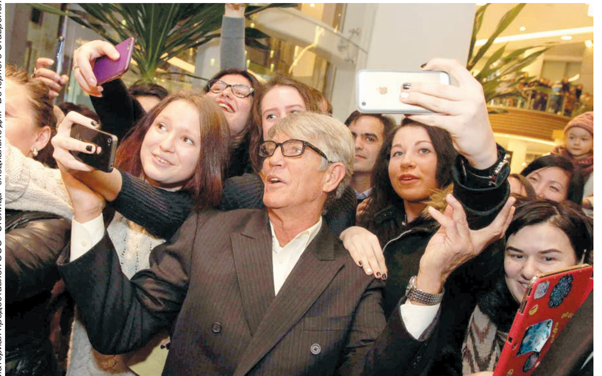
Материал предоставлен ООО «Столица» специально для «Вечернего Ставрополя».