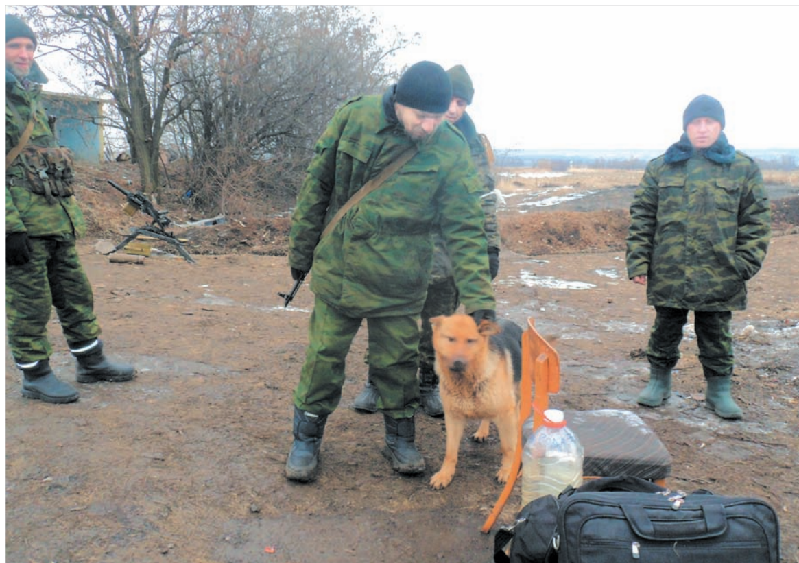
Животные ищут защиты у людей.

противника так же. Они воюют не с украинской армией, не с нацгвардией и даже не с наемниками Коломойского – они воюют с фашистами.