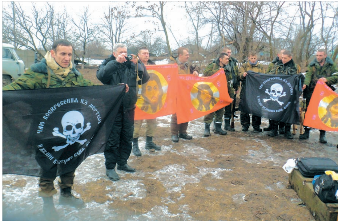
Стяги Спаса и атамана Бакланова в ополчении Новороссии особо почитаемые.