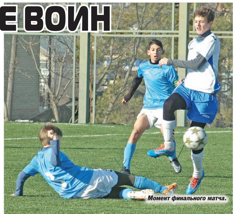
Момент финального матча.