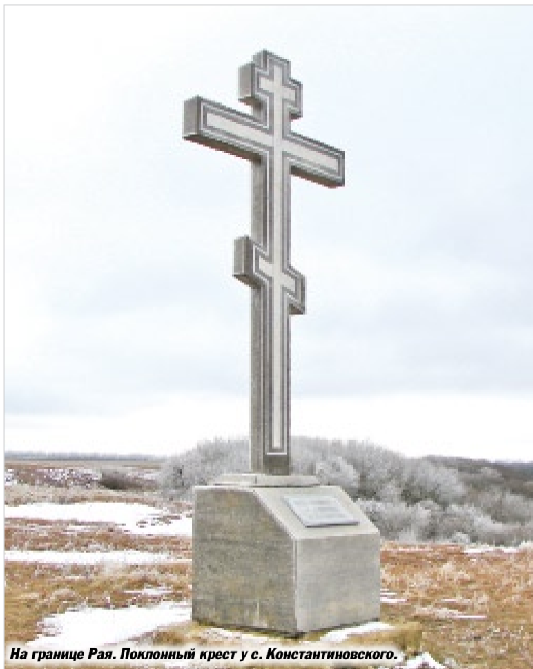
На границе Рая. Поклонный крест у с. Константиновского.