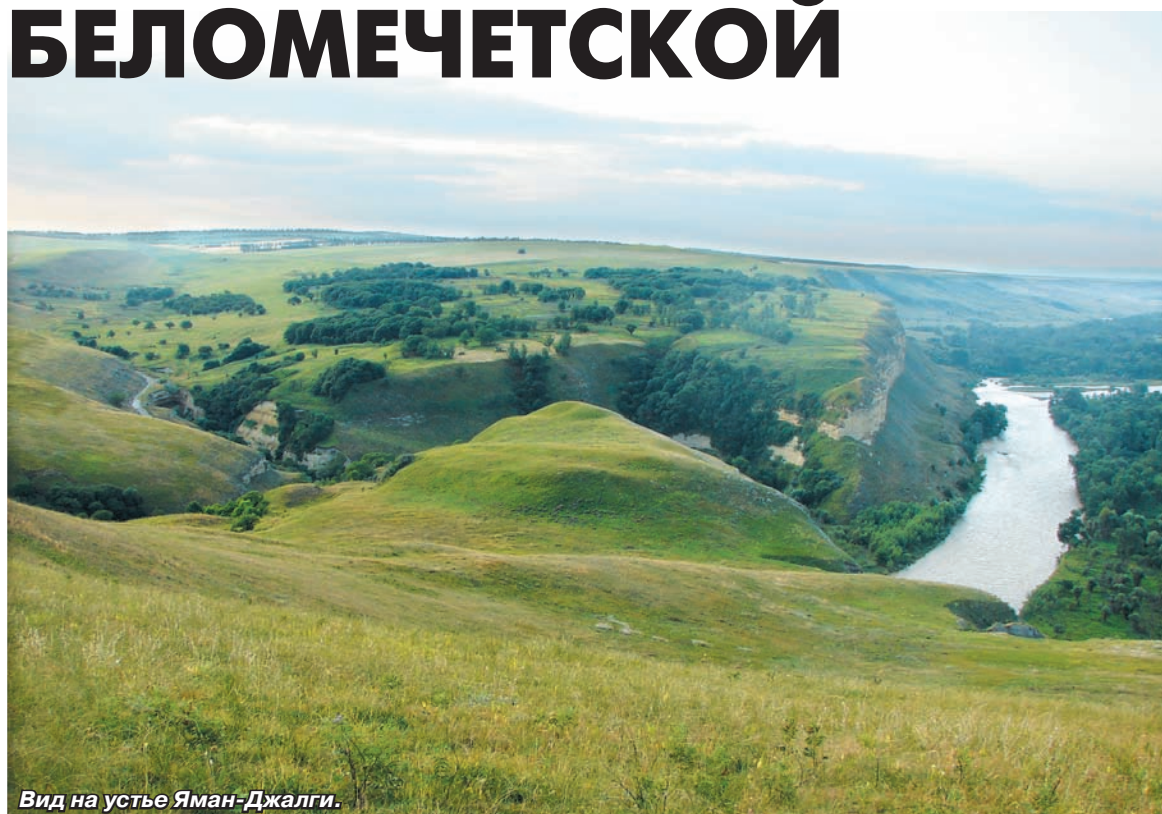
Вид на устье Яман-Джалги.

В шести километрах от Беломечетской дорога достигает водораздела. Вправо, подобно не-