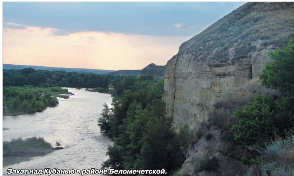
Закат над Кубанью в районе Беломечетской.