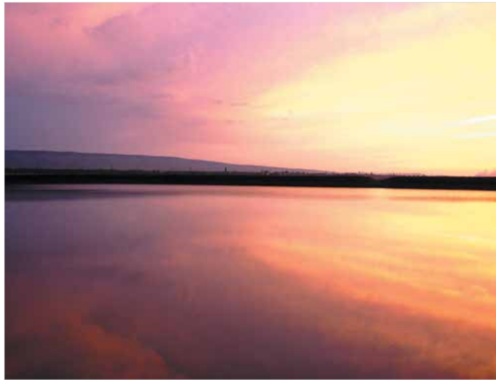
Закат в Итальянской балке.

В конце 1920-х были построены нефтеперекачивающая станция и около десятка домов при ней. Хутор Рыбалкин, как вначале именовался населенный пункт, быстро рос. Связанные по роду службы с железной дорогой старались селиться к