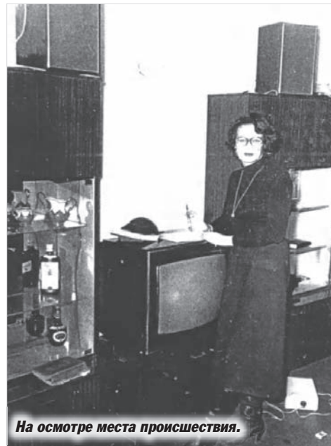
На осмотре места происшествия.