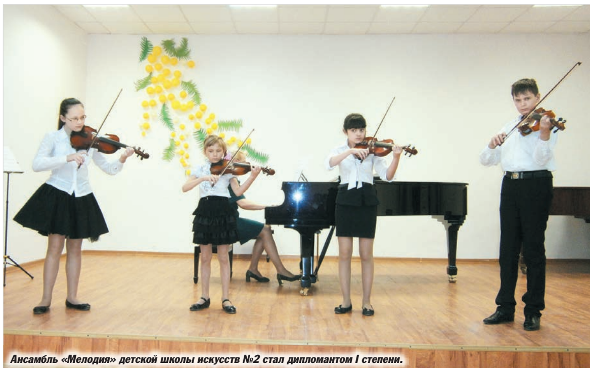
Ансамбль «Мелодия» детской школы искусств №2 стал дипломантом I степени.