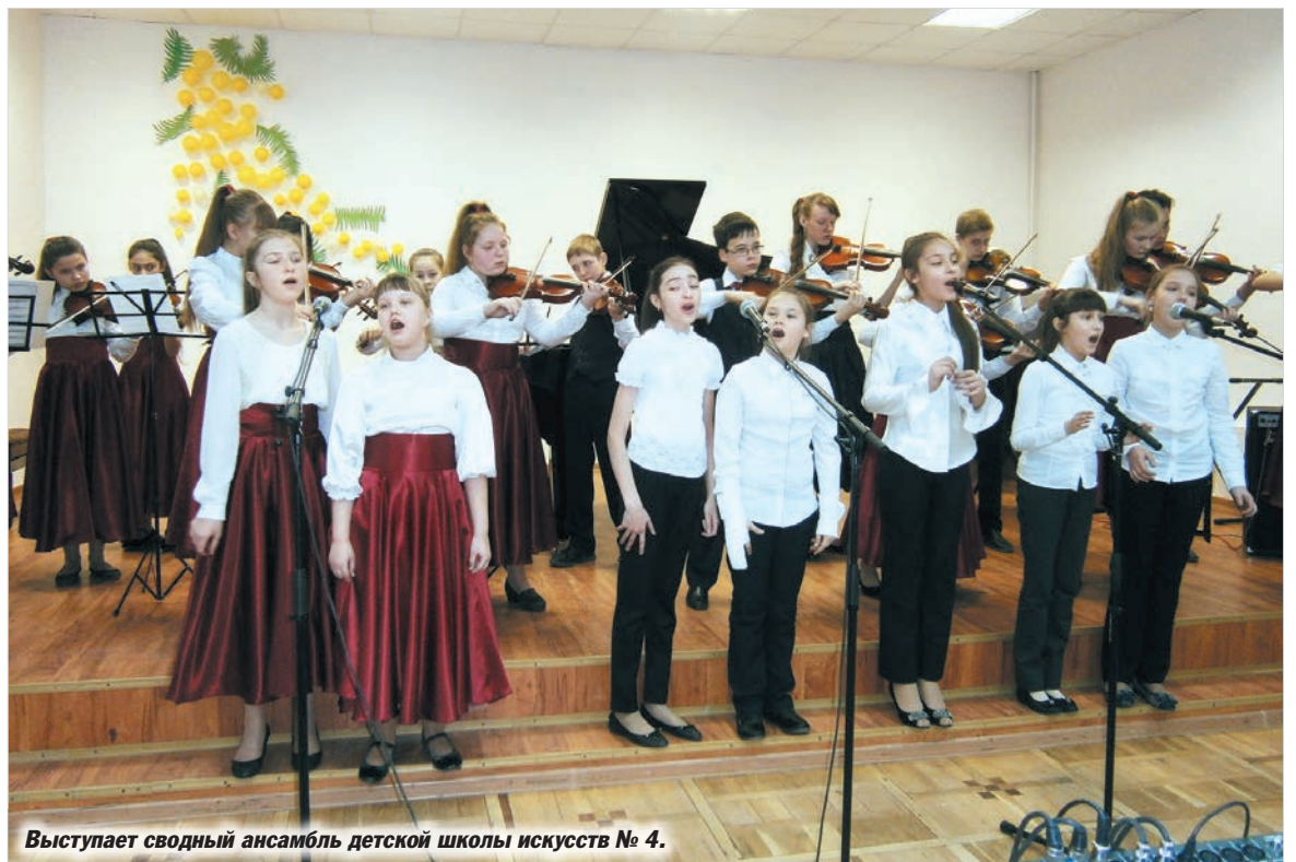
Выступает сводный ансамбль детской школы искусств № 4.