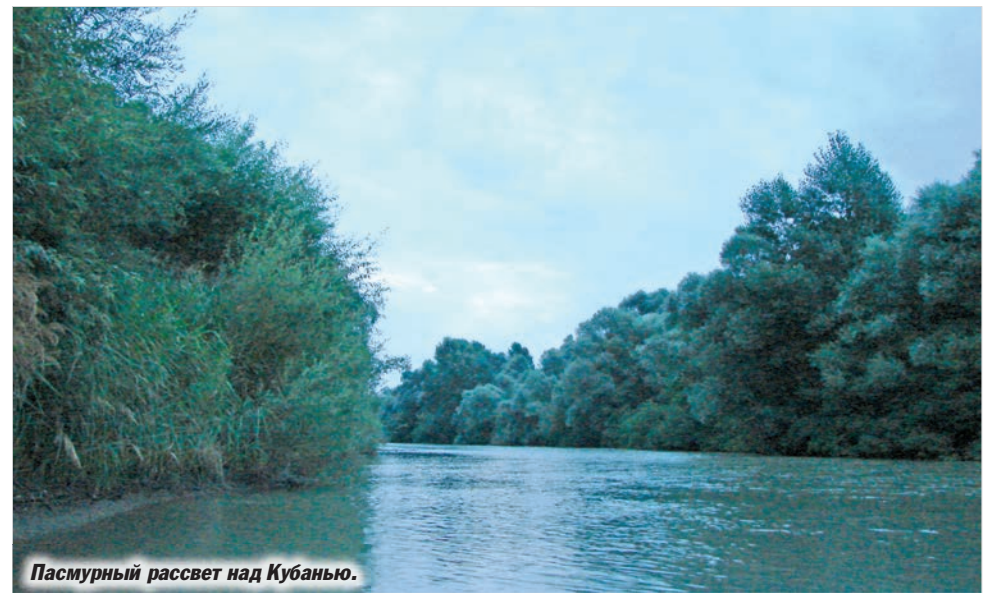
Пасмурный рассвет над Кубанью.

21 МАРТА - МЕЖДУНАРОДНЫЙ ДЕНЬ КУКОЛЬНИКА