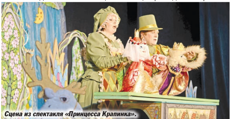
Сцена из спектакля «Принцесса Крапинка».