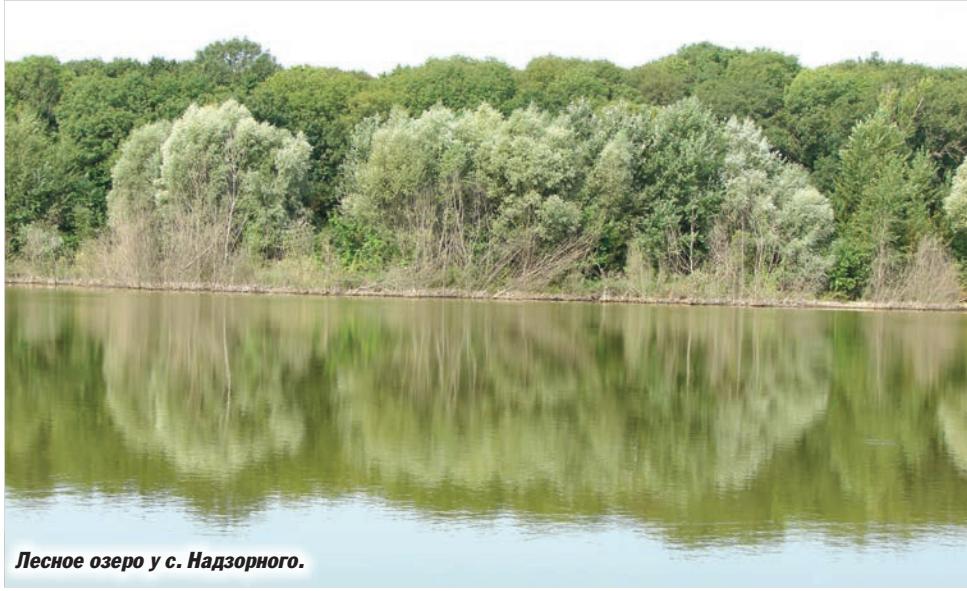
Лесное озеро у с. Надзорного.