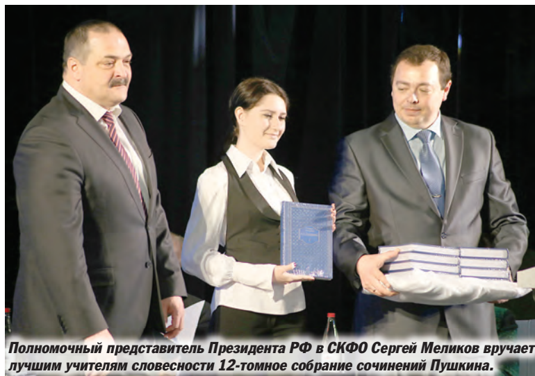
Полномочный представитель Президента РФ в СКФО Сергей Меликов вручает лучшим учителям словесности 12-томное собрание сочинений Пушкина.