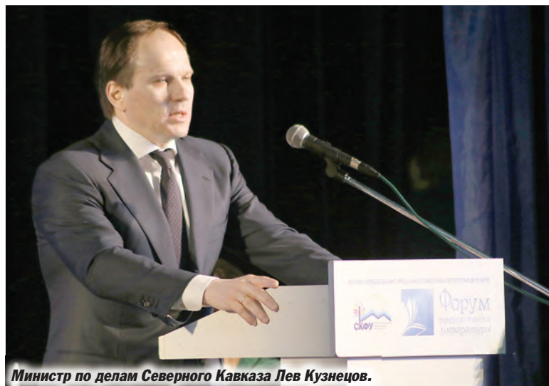
Министр по делам Северного Кавказа Лев Кузнецов.

– Более того, – продолжал он, – учитывая, что на территории нашей страны законодательством субъектов РФ статусом государственного наделены еще 36 национальных языков и 15 признаются в качестве официальных, развитие