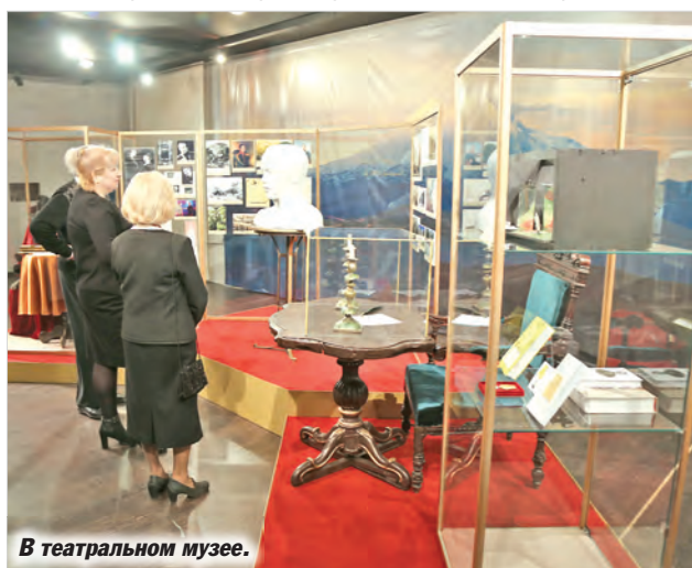
В театральном музее.