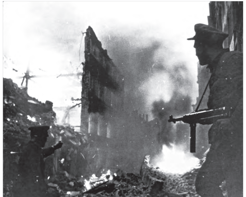
Советские бойцы в уличном бою в Глогу (ныне – Глогув, Польша), апрель 1945 г. Автор Рафаил Мазелев.

Войска 3-го УКРАИНСКОГО фронта, продолжая наступление, 1 апреля овладели городом ШОПРОН – крупным железнодорожным узлом и важным опорным пунктом обороны немцев на подступах к ВЕНЕ, а также заняли на территории Венгрии более 100 других населённых пунктов и среди них ФОРТЕРАКОШ, АГФАЛЬВА, БРЕННБЕРГ, ВАШКЕРЕСТЕШ, ПАРНОПАТИ, СЕНТТЕРФА, ПИНКОМИНОСЕНТ. Одновременно на территории Австрии, восточнее и южнее города ВИНЕР НОЙШТАДТ, войска фронта заняли более 30 населённых пунктов, в том числе РУСТ, ТРАУЕРСДОРФ, ЗИГЕНДОРФ, ДРАСБУРГ, МАТЕРСБУРГ, ФОРХТЕНАУ, БРОМБЕРГ, КИРХАУ. Юго-западнее озера БАЛАТОН войска фронта, действуя совместно с войсками болгарской армии, заняли более 60 населённых пунктов, среди которых крупные населённые пункты КИШКОМАРОМ, ГАЛАМБОК, ИХАРОШБЕРЕНЬ, ИХАРОШ, ЕГЕР-АРАЧА, УЮДВАР, ШАНЦ, БАГОЛА ШАНЦ, ЛИСО, ШУРД, ДЬБЕКЕНЬЕШ и железнодорожные станции КОМАРВАРОШ, СЕНТ-ЯКОВ. В боях за 31 марта войска фронта взяли в плен более 26000 солдат и офицеров противника и захватили следующие трофеи: самолётов – 127, танков – 17, полевых орудий – 291, пулемётов – 1547, автомашин –