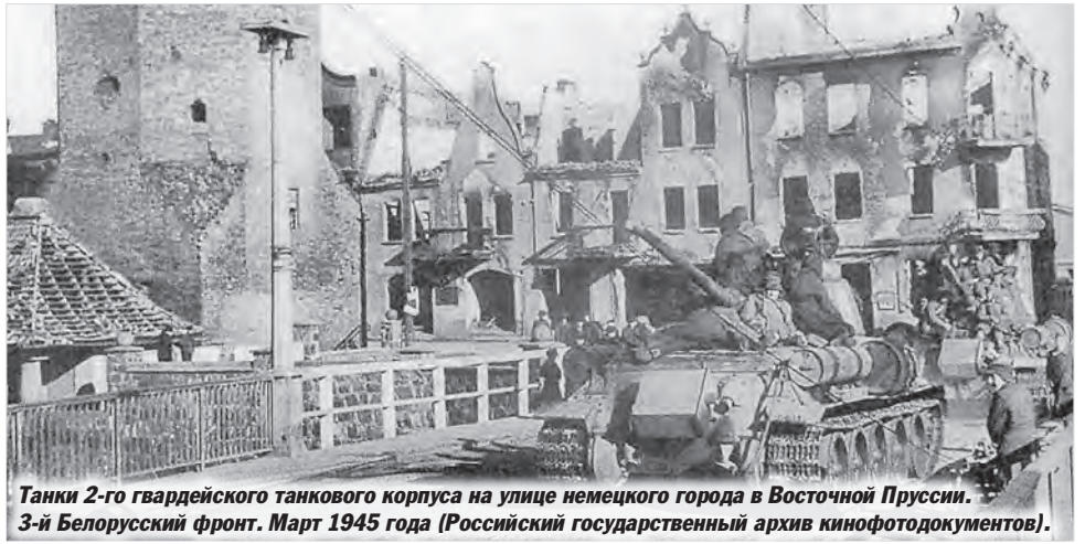
Танки 2-го гвардейского танкового корпуса на улице немецкого города в Восточной Пруссии. 3-й Белорусский фронт. Март 1945 года.

Войска 3-го УКРАИНСКОГО фронта, продолжая наступление, 26 марта овладели городами ПАПА и ДЕВЕЧЕР - крупными узлами дорог и сильными опорными пунктами обороны немцев, прикрывающими пути к границам Австрии, а также заняли более 100 других населённых пунктов, среди которых крупные населённые пункты БАКОНЬ-