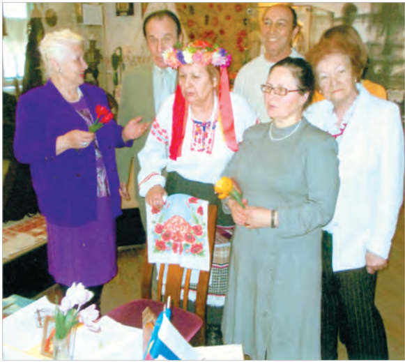
На заседании общества российско-украинской дружбы «Днипро».

В Ставропольском государственном музее-заповеднике имени Г.Н. Прозрителева и Г.К. Праве состоялась встреча, организованная обществом российско-украинской дружбы «Днипро». Главной её темой стала 201-я годовщина со дня рождения украинского поэта, художника, философа Тараса Шевченко.