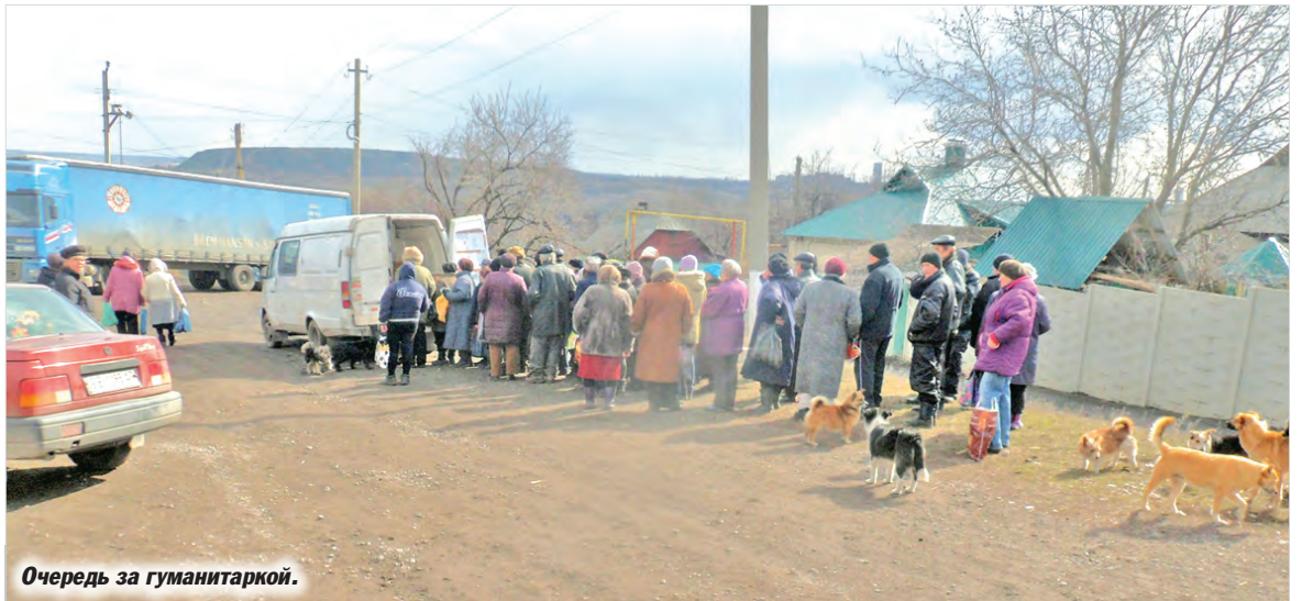
Очередь за гуманитаркой.