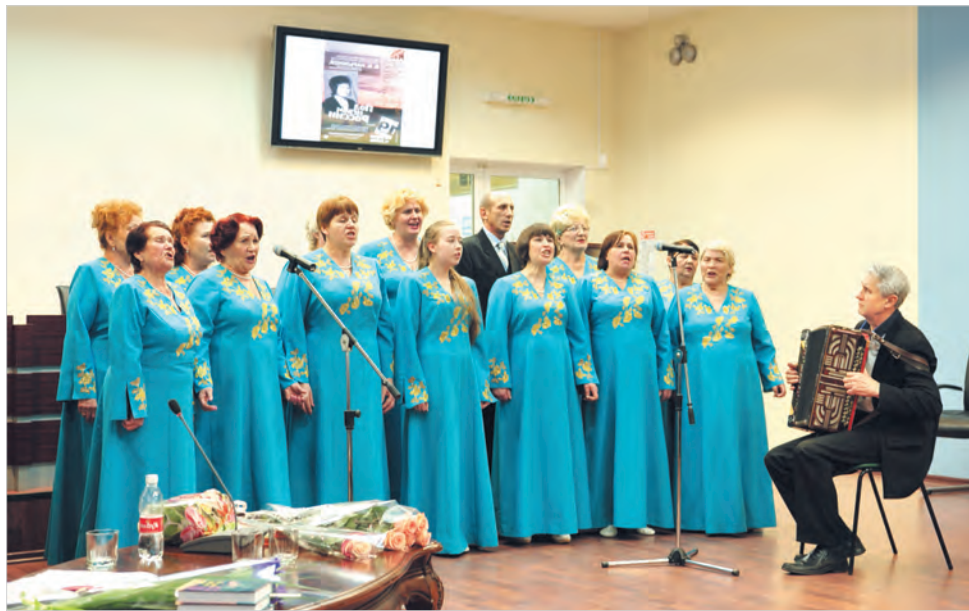
Выступает народный хор «Огонёк».