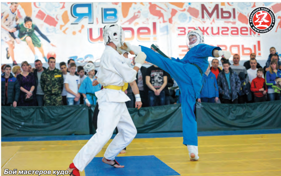
Бой мастеров кудо.

В соревнованиях, в которых принимали участие бойцы из Дагестана, Карачаево-Черкесии, Астраханской, Волгоградской и Ростовской областей, ставропольцы добились 25 медалей, в том числе 11 – золотых. Теперь представители юга страны готовятся к участию в двух ответственных соревнованиях, которые пройдут в Москве во второй половине апреля, – чемпионату России и Межрегиональному турниру офицеров ГРУ.