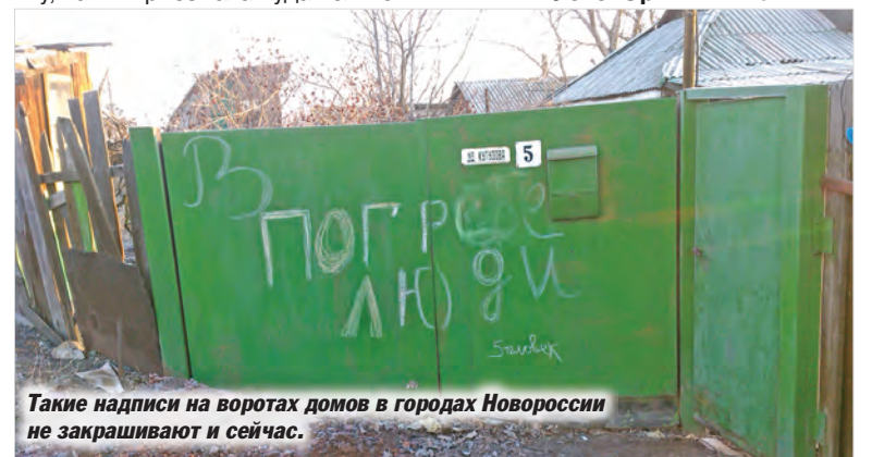
Такие надписи на воротах домов в городах Новороссии не закрашивают и сейчас.