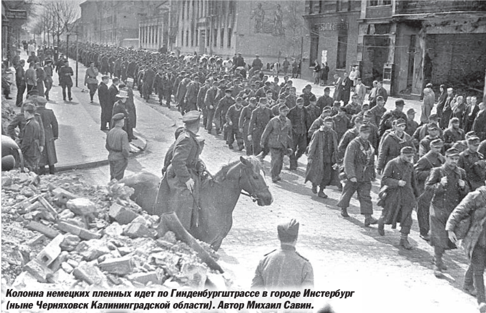
Колонна немецких пленных идет по Гинденбургштрассе в городе Инстербург (ныне Черняховск Калининградской области).

По данным 3-го БЕЛОРУССКОГО фронта, после 21 ч. 30 м. 9 апреля, т. е. после прекращения сопротивления немецких войск в Кенигсберге, в течение ночи с 9 на 10 и днём 10 апреля сдались в плен около 50 тысяч немецких солдат и офицеров.