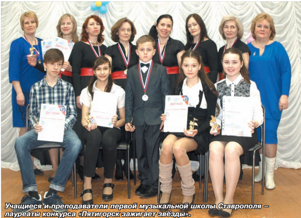
Учащиеся и преподаватели первой музыкальной школы Ставрополя – лауреаты конкурса «Пятигорск зажигает звёзды».