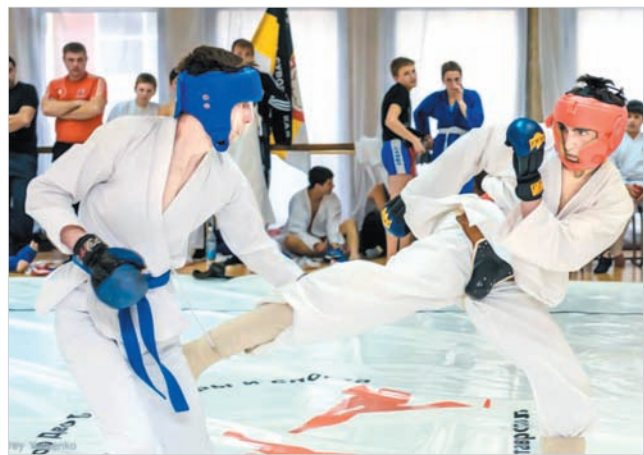
Бой за Кубок.

В Ставропольском Дворце культуры и спорта прошли традиционные соревнования по каратэ за Кубок ДКиС, в которых принимали участие бойцы не только из Ставрополя, но и Пятигорска, Невинномысска, Курсавки и станицы Суворовской Предгорного района.