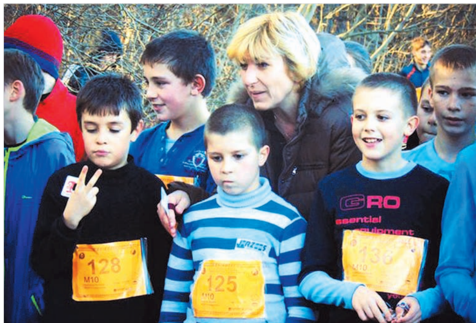
Последние наставления тренера перед стартом.

17 мая планируется провести два старта: всероссийский «Российский азимут» и второй этап «Ставропольского компаса – 2015».