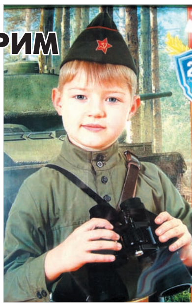
«Я – тоже будущий солдат!»