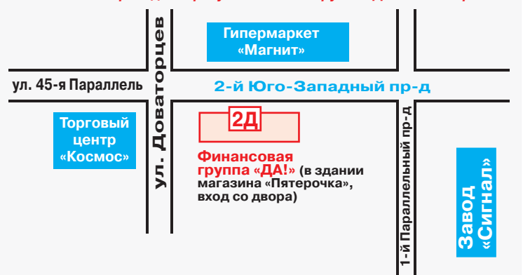
Схема проезда к офису Финансовой группы «ДА!» в г. Ставрополе.

г. Невинномысск, ул. Гагарина, 63, Торговый центр «Статус», 5-й этаж, 1-й офис. Тел. 8 (8652) 59-90-95, 8-938-302-90-95