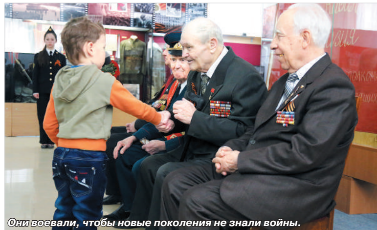
Они воевали, чтобы новые поколения не знали войны.