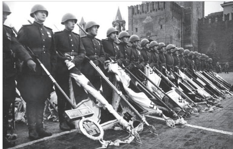
Парад Победы 1945 г.

Все так, но как посчитать то, что не поддается сложению и вычитанию – силу духа. Это энергии, с помощью которых голыми руками рвут заграждения из колючей проволоки и с одной гранатой бесстрашно поднимаются на танк неприятеля. Как и в какую строчку анализа вписать этих сорвиголов. Ведь и на самом деле, зачастую бесстрашные и были бессмертными. Видно дух обожает смелых. Дух был сильнее пушек и пулеметов. Хотя немцы, необходимо отметить, и на самом деле воевать умели – сказывалась прусская