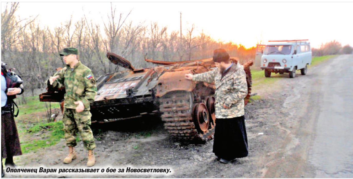
Ополченец Варан рассказывает о бое за Новосветловку.