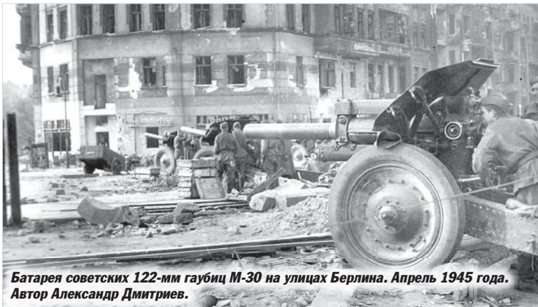
Батарея советских 122-мм гаубиц М-30 на улицах Берлина. Апрель 1945 года.

Войска 3-го БЕЛОРУССКОГО фронта 25 апреля овладели последним опорным пунктом обороны немцев на Земландском полуострове городом и крепостью ПИЛЛАУ - крупным портом и военно-морской базой немцев на Балтийском море, а также заняли населенные пункты ЛОХШТАДТ, НОЙХОЙЗЕР, ХИММЕЛЬРАЙХ, ПЛАНТАГЕ, КАМСТИГАЛЛ.