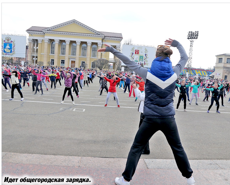
Идет общегородская зарядка.