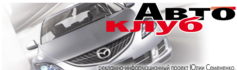
рекламно-информационный проект Юлии Семененко.