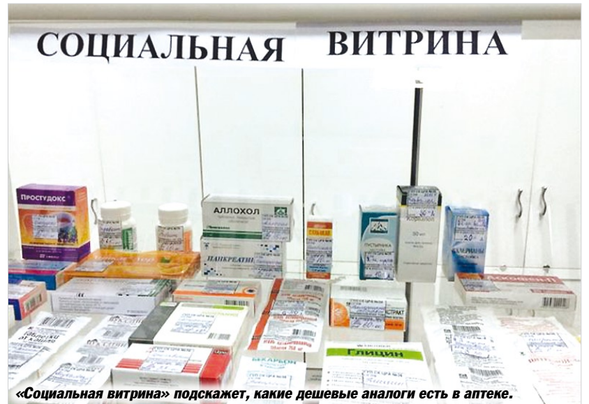
«Социальная витрина» подскажет, какие дешевые аналоги есть в аптеке.