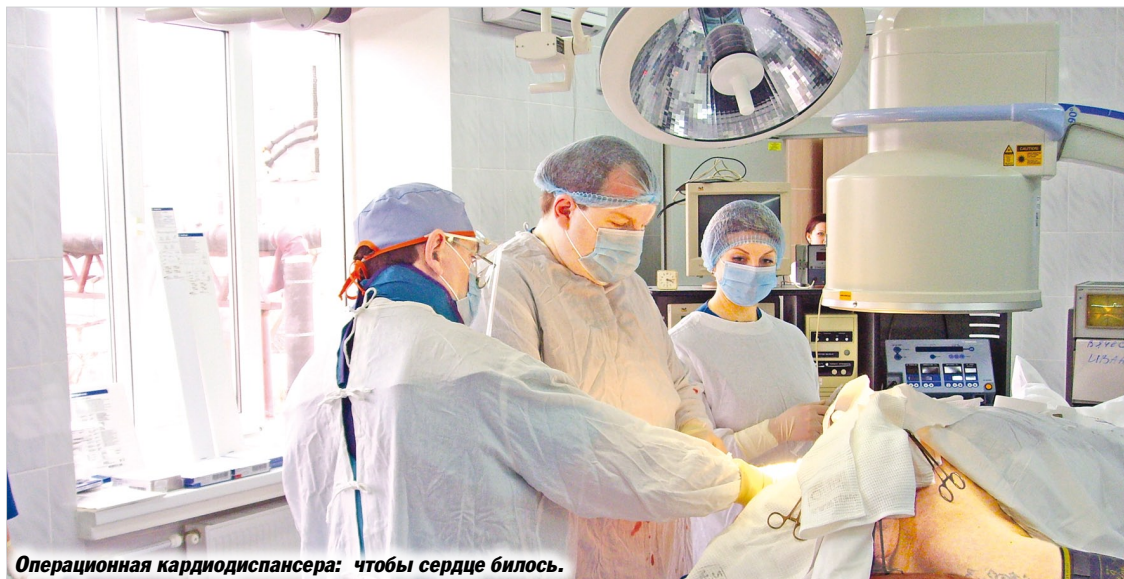
Операционная кардиодиспансера: чтобы сердце билось.