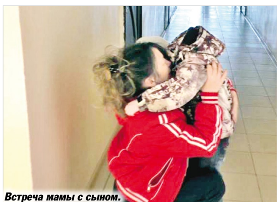
Встреча мамы с сыном.