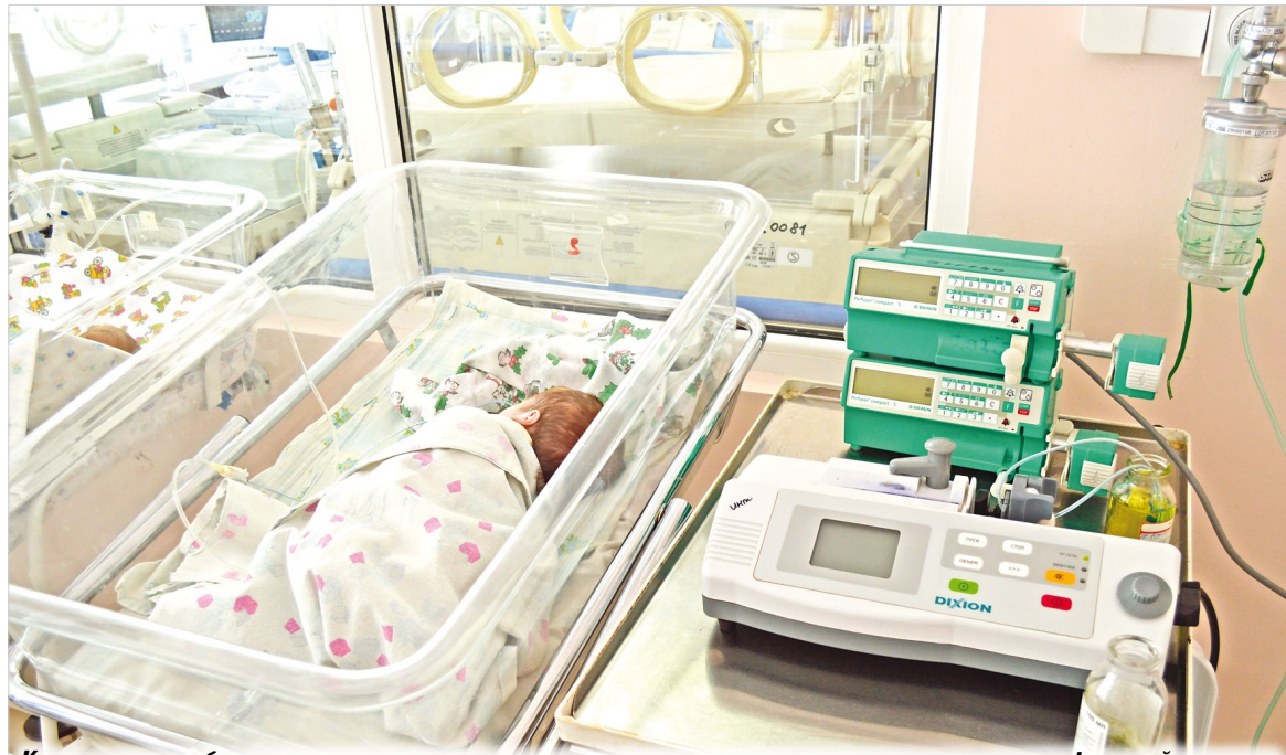
Краевая детская больница: здесь выхаживают новорожденных, внося лепту в улучшение демографической ситуации.