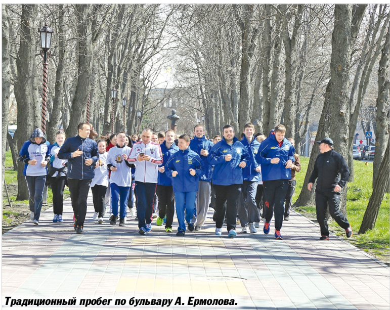
Традиционный пробег по бульвару А. Ермолова.