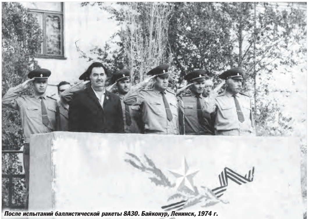
После испытаний баллистической ракеты 8А30. Байконур, Ленинск, 1974 г.