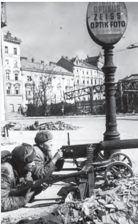
Советские пулеметчики ведут уличный бой в центральной части города Вены. Апрель 1945 года.

За 10 апреля подбито и уничтожено 13 немецких танков. В воздушных боях и огнём зенитной артиллерии сбито 16 самолётов противника.