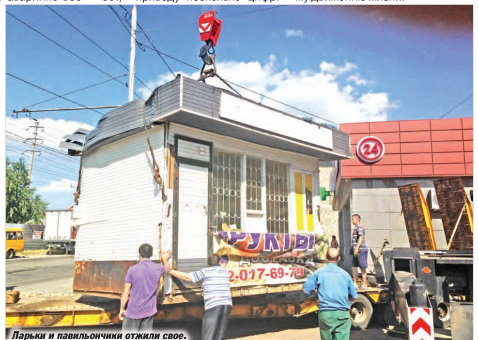
Ларьки и павильончики отжили свое.