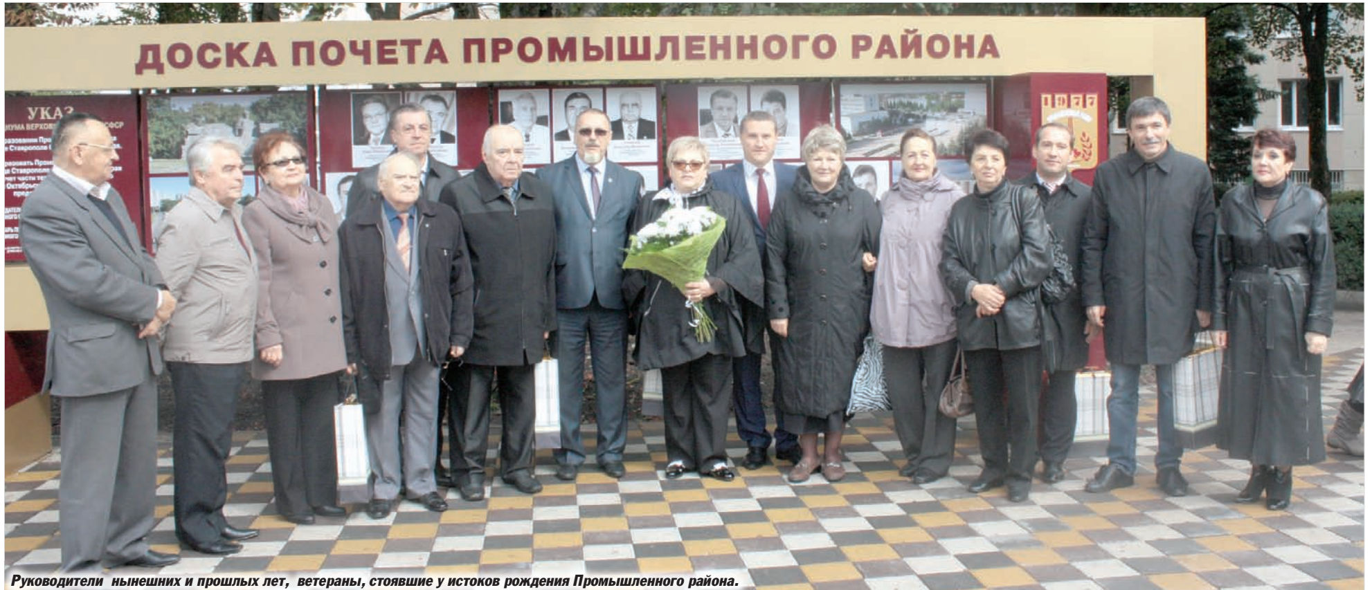
Руководители нынешних и прошлых лет, ветераны, стоявшие у истоков рождения Промышленного района.