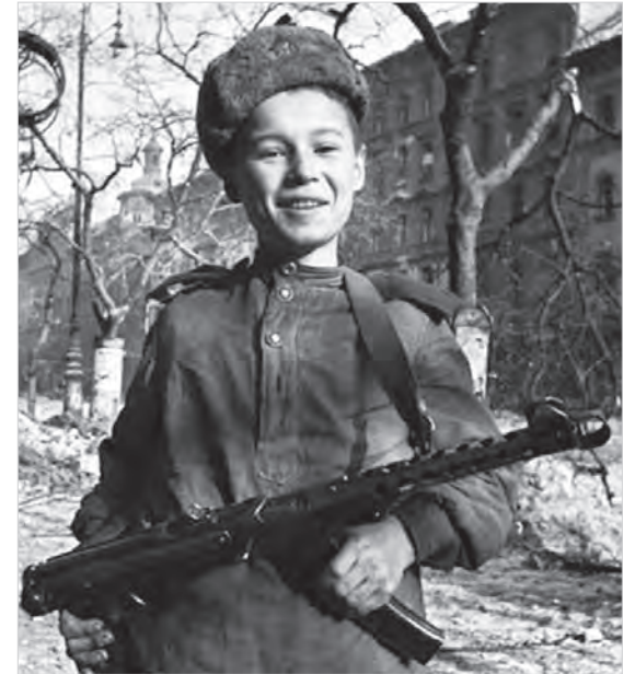
Сын полка на улице Будапешта.

Войска 2-го УКРАИНСКОГО фронта, продолжая наступление, 17 апреля овладели центром нефтеносного района Австрии – городом ЦИСТЕРСДОРФ, а также заняли более 30 других населённых пунктов, и среди них ПАЛЬТЕРНДОРФ, МАУСТРЕНК, КЕТТЛАСБРУН, ПААСДОРФ, ХЕБЕРСБРУН, ВОЛЬФПАССИНГ, ХАУТЦЕНДОРФ и железнодорожные станции ДОБЕРМАННСДОРФ, ГЕСТИНГ, ПААСДОРФ. На территории Чехословакии северо-западнее города ГОДОНИН войска фронта заняли населённые пункты КРУМВИР, ШИТБОРИЦЕ, КРЖЕПИЦЕ, ГУСТОПЕЧЕ, СТАРОВИЦЕ, ПОПИЦЕ, ВРАНОВИЦЕ.