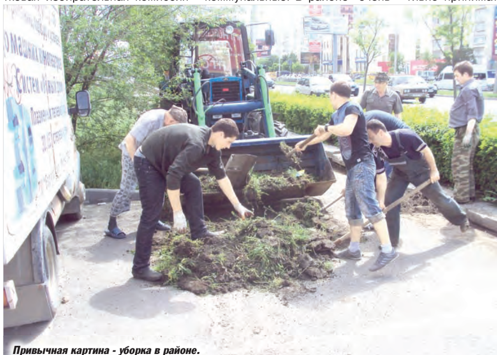
Привычная картина - уборка в районе.

Каждый день что-то меняется в облике района, и мы рады этому движению жизни.