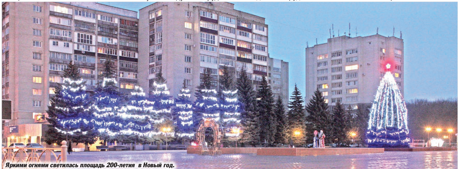
Яркими огнями светилась площадь 200-летия в Новый год.

Я поздравляю горожан, жителей района с нашим праздником, желаю всем здоровья, благополучия, мира, успехов во всех хороших начинаниях на благо родного Ставрополя. Пусть цветет, крепнет, хорошеет наш любимый Промышленный район!