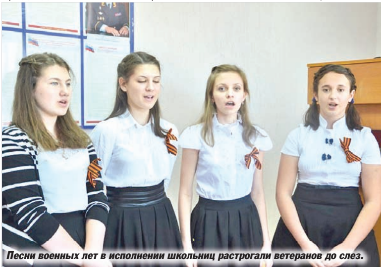
Песни военных лет в исполнении школьниц растрогали ветеранов до слез.