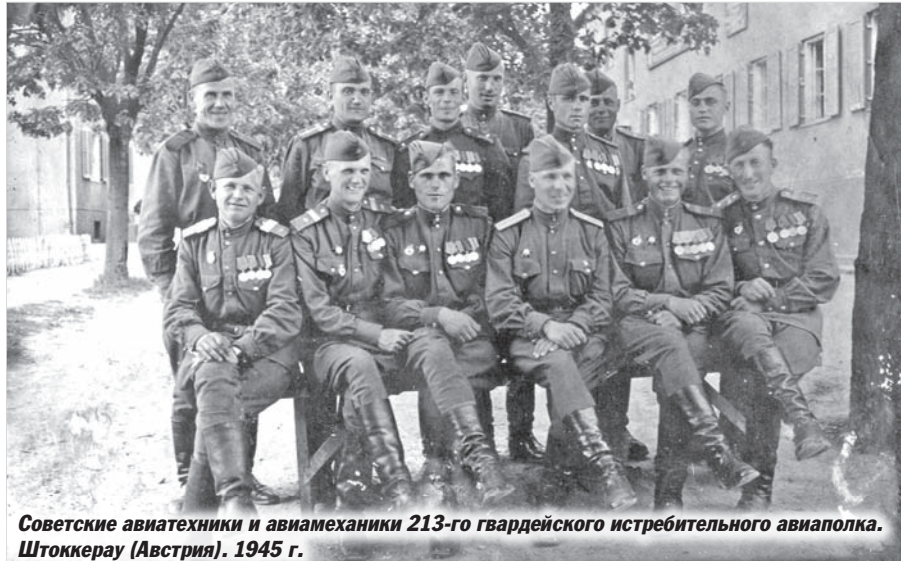
Советские авиатехники и авиамеханики 213-го гвардейского истребительного авиополка. Штоккерау (Австрия). 1945 г.

В течение 22 апреля Центральная группа наших войск продолжала вести наступательные бои на ДРЕЗДЕНСКОМ и БЕРЛИНСКОМ направлениях.