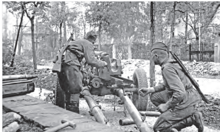
Советские артиллеристы ведут огонь на улице в предместье Берлина. Апрель 1945 года.

Войска 4-го УКРАИНСКОГО фронта, продолжая наступле-