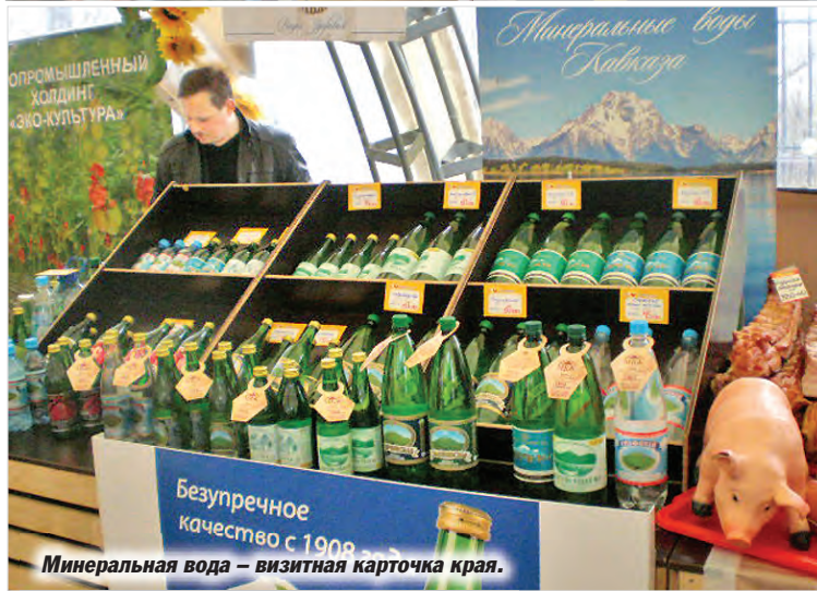
Минеральная вода – визитная карточка края.