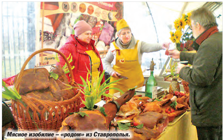
Мясное изобилие – «родом» из Ставрополя.