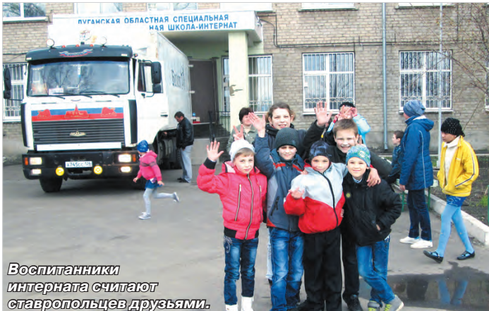
Воспитанники интерната считают ставропольцев друзьями.