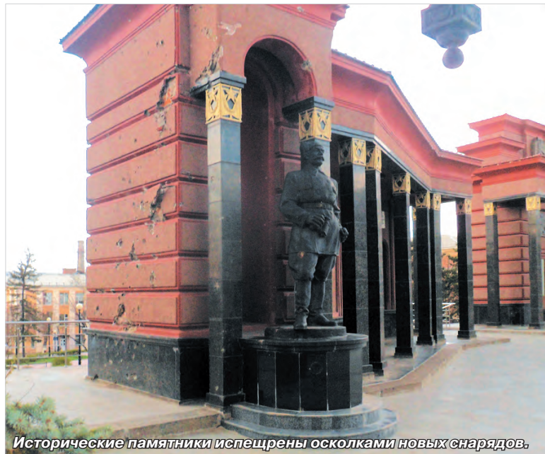
Исторические памятники испещрены осколками новых снарядов.