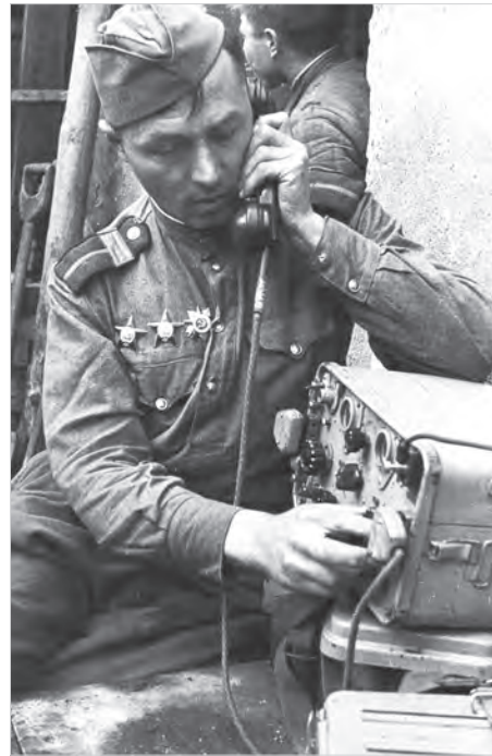
Советский старшина-связист у ради во время боев в Берлине. Апрель 1945 года.

На территории Чехословакии восточнее города БРНО войска 2-го УКРАИНСКОГО фронта, продолжая наступление, с боями заняли крупные населённые пункты БОРШИЦЕ, ОСВЬЕТИМАНЫ, ВРЖЕСОВИЦЕ, НЕХВАЛИН, ЛОВЧИЦЕ, ЖДЯНИЦЕ, БУЧОВИЦЕ, ОРЛОВИЦЕ, МОРАВСКИ ПРУСЫ, ДРНОВИЦЕ.