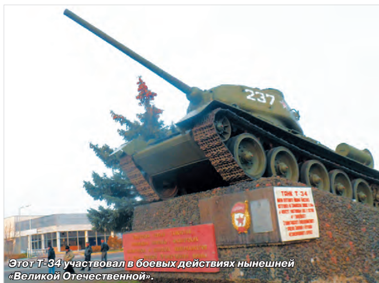
Этот Т-34 участвовал в боевых действиях нынешней «Великой Отечественной».

участке летом прошлого года во многом решалась судьба столицы ЛНР. Во славу освободителей города здесь установлен памятник – орел, поднимающий знамя. Сейчас все это наполняется особым смыслом.