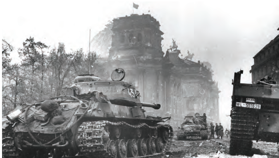
Советские танки ИС-2 7-й гвардейской танковой бригады у рейхстага. На переднем плане — танк № 434 «Боевая подруга».

Войска 2-го БЕЛОРУССКОГО фронта, развивая наступление, 30 апреля овладели городами ГРАЙФСВАЛЬД, ТРЕПТОВ, НОЙШТРЕЛИЦ, ФЮРСТЕНБЕРГ, ГРАНЗЕЕ - важными узлами дорог в северо-западной части Померании и в Мекленбурге, а также заняли города ЛАССАН, ВОЛЬГАСТ, РАЙНСБЕРГ и крупные населённые пункты ХАНСХАГЕН, ЦЮССОВ, НОТЦКОВ, ЯРМЕН, БАРТОВ, БУРОВ, ЗАРОВ, ВОЛЬДЕ, ПЕНЦЛИН, ШТРЕЛИЦ, МЕНЦ, ГРОСС ВОЛЬТЕРСДОРФ, ДОЛГОВ. В боях за 29 апреля войска фронта взяли в плен более 1 500 немецких солдат и офицеров и захватили 27 самолётов и 55 полевых орудий.