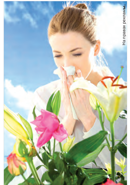
На правах рекламы.

Для полноценной работы иммунной системы, для противодействия аллергии нужны здоровый кишечник и его микрофлора. Пробиотические бактерии, особые микроорганизмы в кишечнике, помогают бороться с чужеродными микробами и продуцировать витамины и др. вещества. Поэтому, как ни парадоксально, бактерии также участвуют в борьбе с аллергией. Наши помощники — полезные молочнокислые бактерии — укрепляют иммунитет, тренируют иммунные клетки и предотвращают ошибки защитной системы в определении аллергенов. Регулярный прием современных качественных пробиотиков (например,