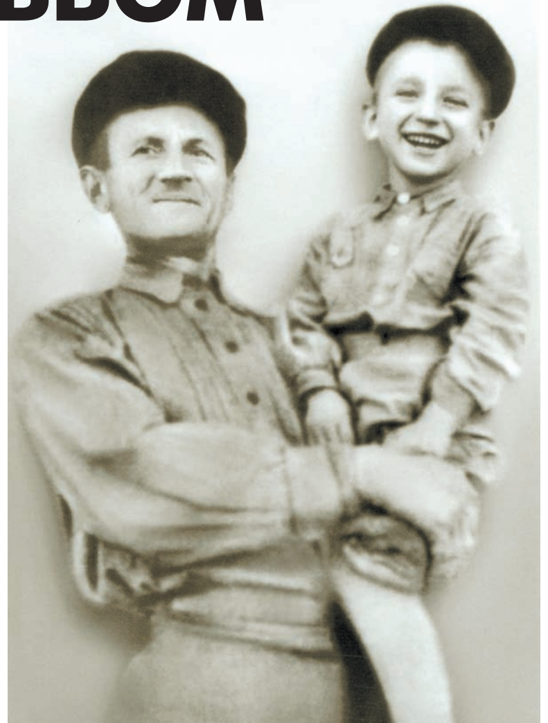
Я на руках у бати. 1949 год.