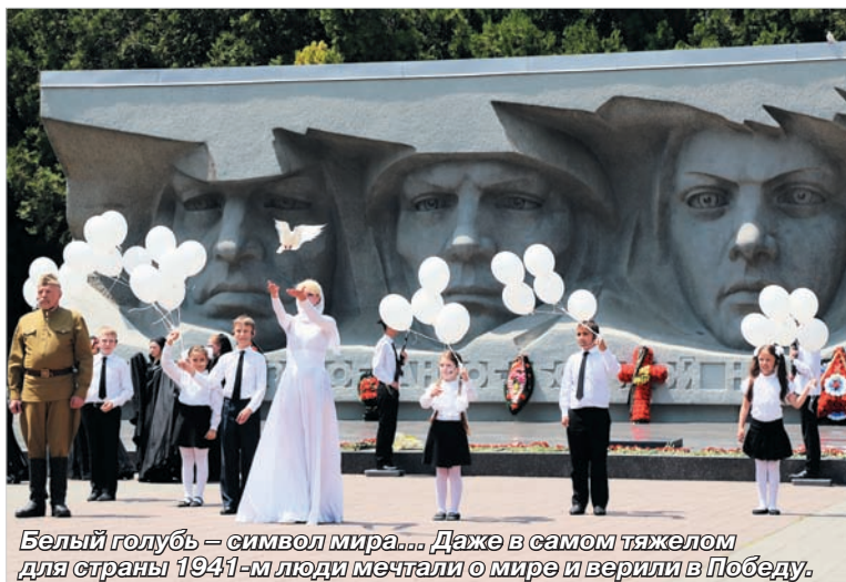
Белый голубь – символ мира... Даже в самом тяжелом для страны 1941-м люди мечтали о мире и верили в Победу.

Несколько часов спустя, во время городского митинга, когда прозвучали слова благодарности ветеранам, отстоявшим Отечество, и труженикам тыла, ковавшим Победу в тылу, когда стих стук метронома во время минуты молчания, вновь заговорили символы в образах, представленных детским хореографическим коллективом, – черной беды, накрывающей мир вороненым крылом, Родины-матери в огненно-алом покрывале, словно вознесшейся над этой тьмой с мечом в руке... И девушки в белом с белым же голубком в руках. И снова в День памяти, как в День Победы, взлетели в небо белый голубь мира и белые шары.