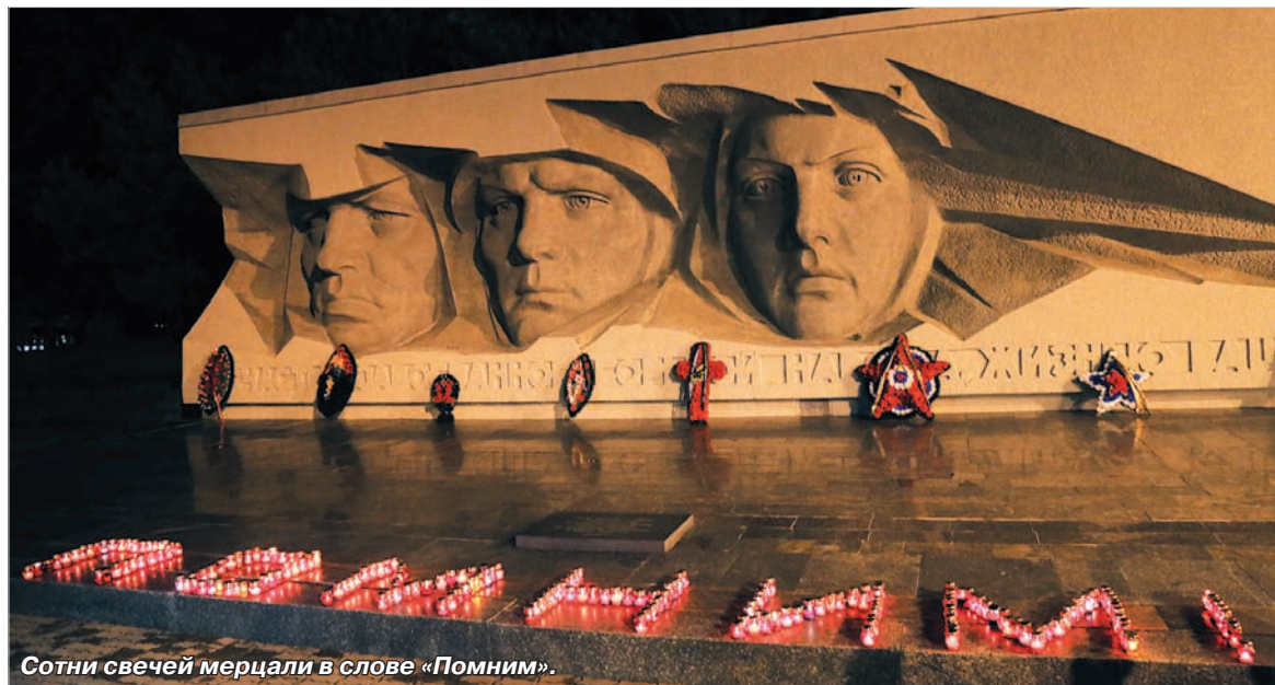
Сотни свечей мерцали в слове «Помним».

дей даже в страшном и невероятно трудном для нашей страны 1941-м.