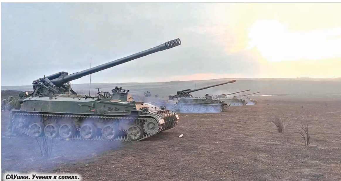
САУшки. Учения в сопках.