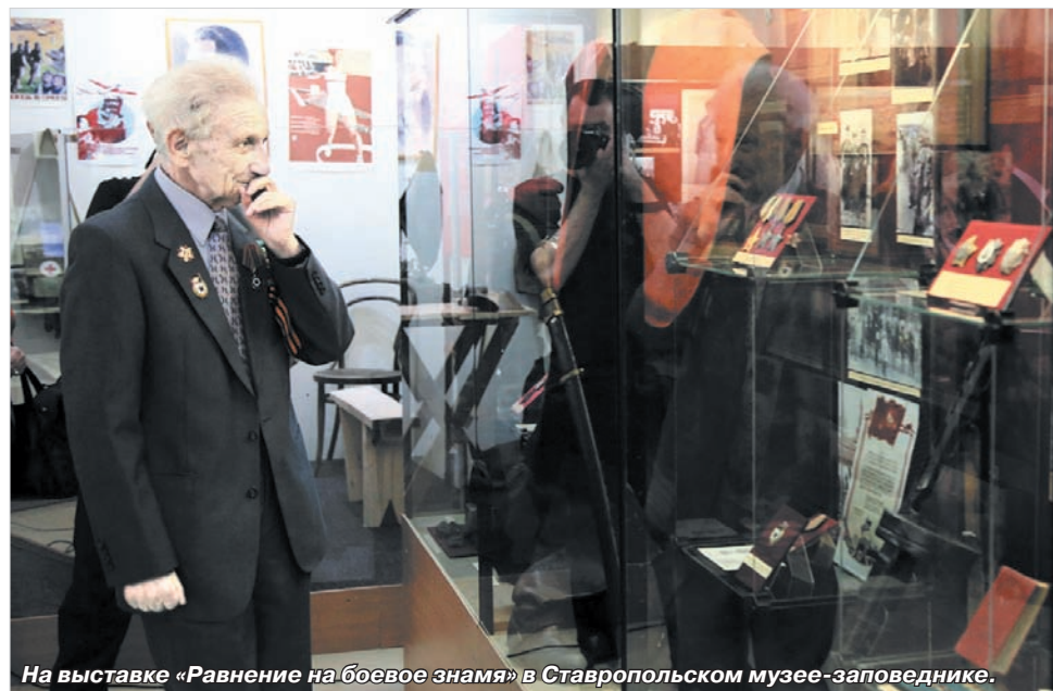
На выставке «Равнение на боевое знамя» в Ставропольском музее-заповеднике.