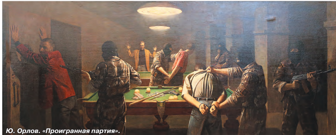
Ю. Орлов. «Проигранная партия».

Работы, представленные в экспозиции, принадлежат кисти нашего земляка заслуженного художника России Юрия Орлова, который приехал в Ставрополь на открытие выставки. Ставропольские знатоки и любители живописи уже знакомы с работами мастера, который после окончания детской художественной школы получил среднее