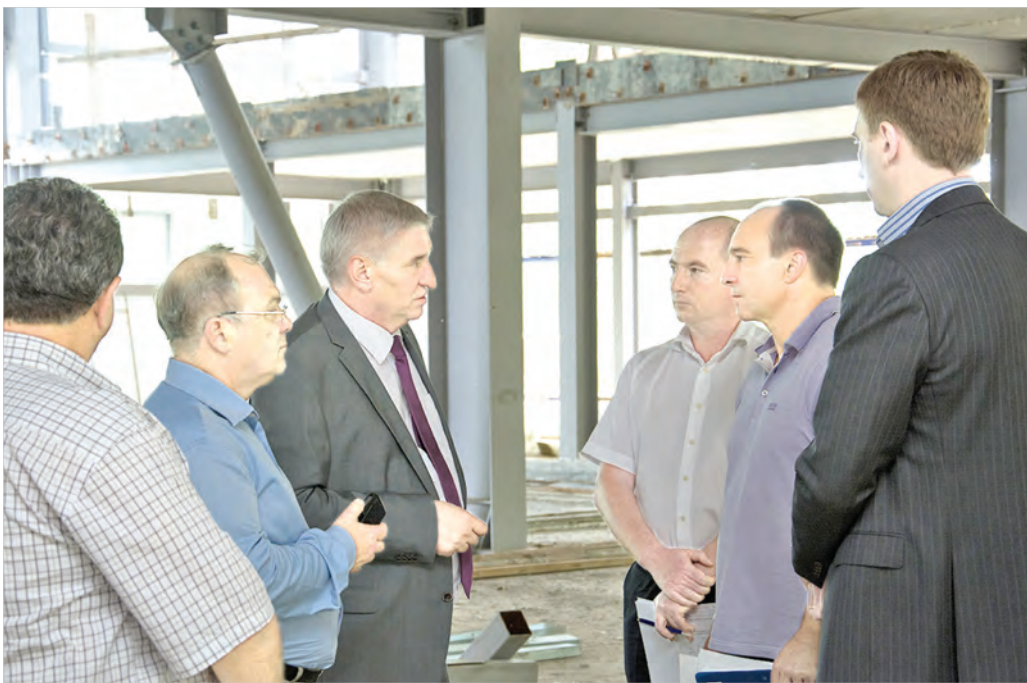
Глава администрации Ставрополя Андрей Джатдоев проинспектировал строительство спортивно-оздоровительного комплекса в Северо-Западном микрорайоне города.

Уникальный по своей архитектуре и содержанию спортивный объект возводится на средства инвестора, он весьма востребован в густонаселенном районе города.