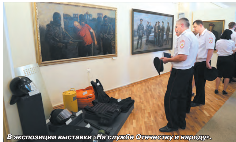
В экспозиции выставки «На службе Отечеству и народу».