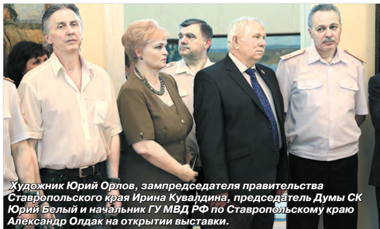
Художник Юрий Орлов, зампреда правительства Ставропольского края Ирина Кувалдина, председатель Думы СК Юрий Белый и начальник ГУ МВД РФ по Ставропольскому краю Александр Олдак на открытии выставки.