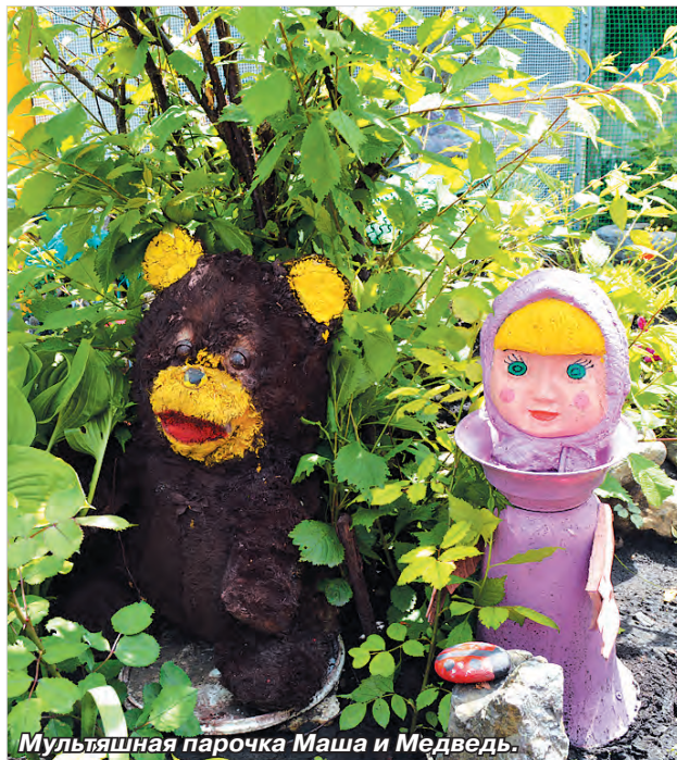
Мультяшная парочка Маша и Медведь.