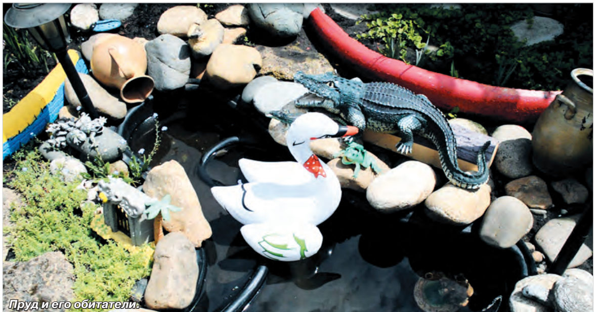
Пруд и его обитатели.

В ход идет все, что можно приспособить для поделок, – и крышки, и старые шляпы, и одежда. Зато вот какой мохна-