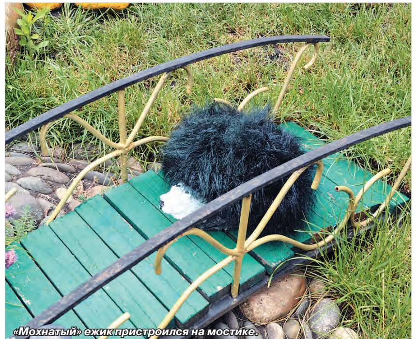
«Мохнатый» ежик пристроился на мостике.