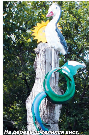
На дереве поселился аист.

Ведущая проекта журналист Лариса ДЕНЕЖНАЯ.