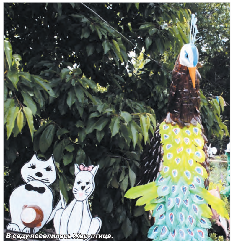
В саду поселилась Жар-птица.