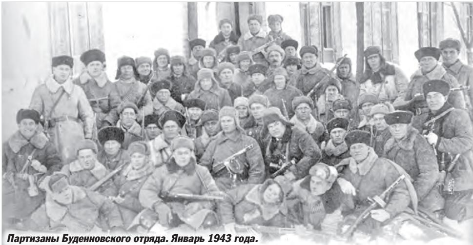
Партизаны Буденновского отряда. Январь 1943 года.

Архивные документы свидетельствуют о трагических и героических страницах истории Ставрополья. В дни наступления советских войск в январе 1943 года партизаны освободили 47 населенных пунктов края, в том числе районные центры Левокумское, Петровское, Арзгир, Летнюю Ставку. Безвозвратные потери ставропольских партизан, согласно официальным спискам, составили 326 человек. В марте 1943 года за выдающуюся доблесть в борьбе против гитлеровских захватчиков 174 партизана были награждены орденами и медалями Советского Союза. В июле того же года 439 ставропольцев были удос-