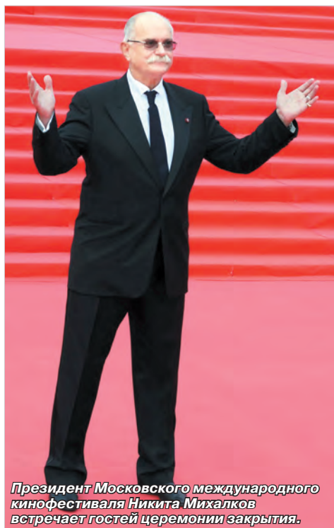
Президент Московского международного кинофестиваля Никита Михалков встречает гостей церемонии закрытия.

В Москве состоялось закрытие 37-го Московского международного кинофестиваля. По этому поводу огромная лестница, ведущая к кинотеатру, превратилась в «красную дорожку». И только ее ширина и высота позволили всем прибывшим кинозвездам и деятелям кино продемонстрировать вечерние туалеты. Хозяин фестиваля, Никита Михалков, лично встречал гостей, которые в этот вечер превратились в королевских особ, девушек с обложек глянцевого журналов и лондонских денди. Со всех сторон звездные гости были окружены многочисленными фото- и видеокамерами, что придавало куражу всем собравшимся. 37-й ММКФ освещали шесть тысяч аккредитованных журналистов со всего мира!