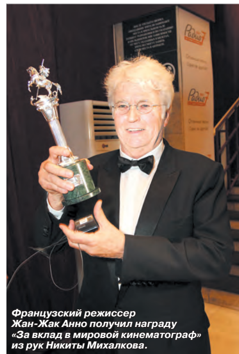
Французский режиссер Жан-Жак Анно получил награду «За вклад в мировой кинематограф» из рук Никиты Михалкова.

«Модный показ» от кинодив является традиционной и важной частью церемонии закрытия. Но он лишь подчеркивает торжественность второй части вечера – награждения победителей. В этом году жюри фестиваля просмотрело более 300 киноработ в разных жанрах. И, как сказал председатель жюри 37-го ММКФ французский кинорежиссер Жан-Жак Анно, короткометражные фильмы обсуждали долго, а полнометражные – быстро, так как были практически едины во мнениях.