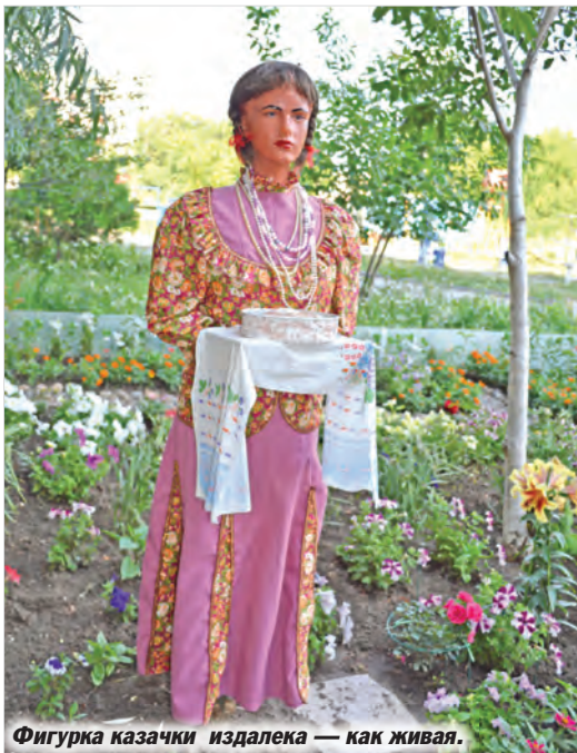
Фигурка казачки издалека — как живая.

Ведущая проекта журналист Лариса ДЕНЕЖНАЯ.