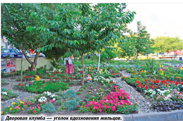
Дворовая клумба — уголок вдохновения жильцов.