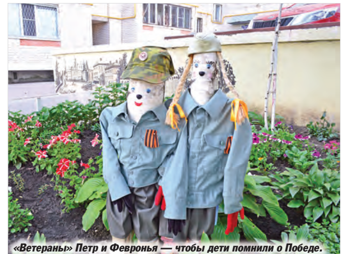
«Ветераны» Петр и Февронья — чтобы дети помнили о Победе.