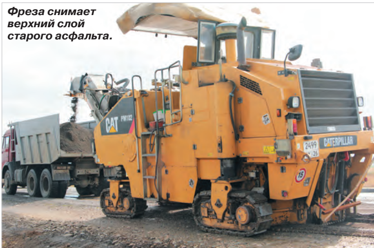
Фреза снимает верхний слой старого асфальта.