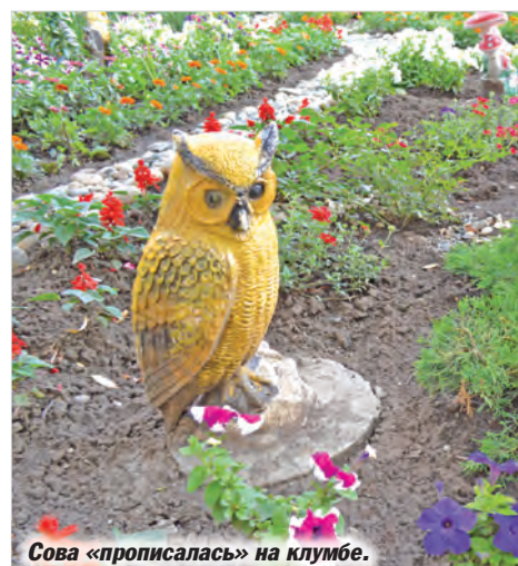
Сова «прописалась» на клумбе.