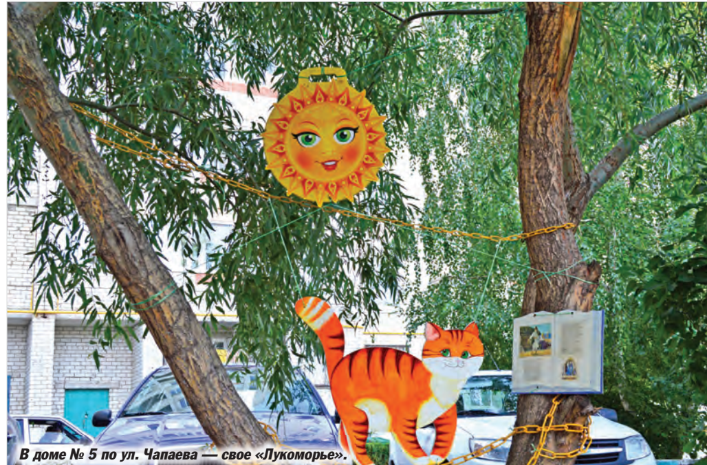
В доме № 5 по ул. Чапаева — свое «Лукоморье».