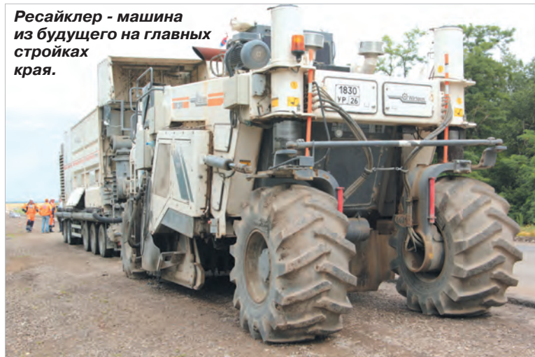
Ресайклер - машина из будущего на главных стройках края.