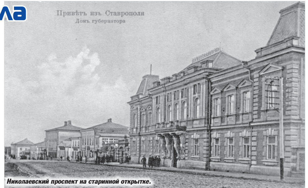
Николаевский проспект на старинной открытке.

Самым популярным и в то же время самым загадочным остается знаменитый