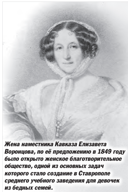
Жена наместника Кавказа Елизавета Воронцова, по её предложению в 1849 году было открыто женское благотворительное общество, одной из основных задач которого стало создание в Ставрополе среднего учебного заведения для девочек из бедных семей.