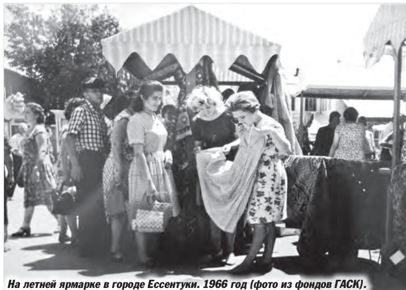
На летней ярмарке в городе Ессентуки. 1966 год.