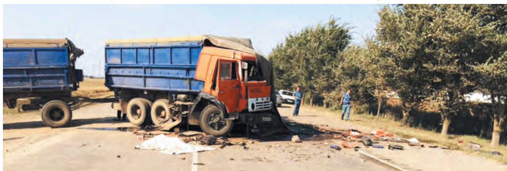
В результате столкновения КамАЗа и «Скании» оба водителя погибли.

Воскресенье также не обошлось без трагедий: в 15 авариях погибли три человека, еще 21 получили травмы. В самом начале суток, в половине первого ночи, в Буденновском районе водитель автобуса выехал на встречную полосу, где врезался в автомобиль ВАЗ-2114. Водитель «Жигулей» погиб.