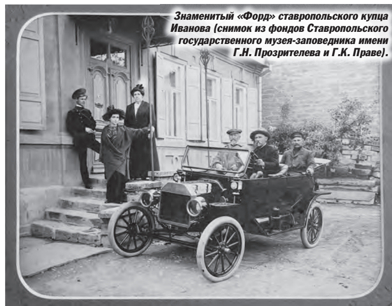
Знаменитый «Форд» ставропольского купца Иванова.