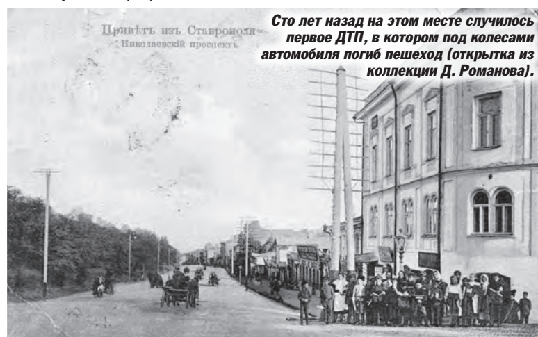
Сто лет назад на этом месте случилось первое ДТП, в котором под колесами автомобиля погиб пешеход (открытие из коллекции Д. Романова).