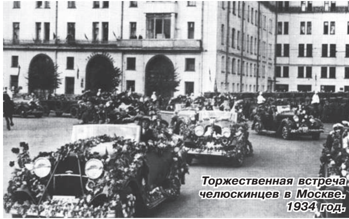
Торжественная встреча челюскинцев в Москве, 1934 год.

16 апреля 1934 года постановлением ЦИК СССР была установлена высшая степень отличия - звание «Герой Советского Союза», которое присваивалось за